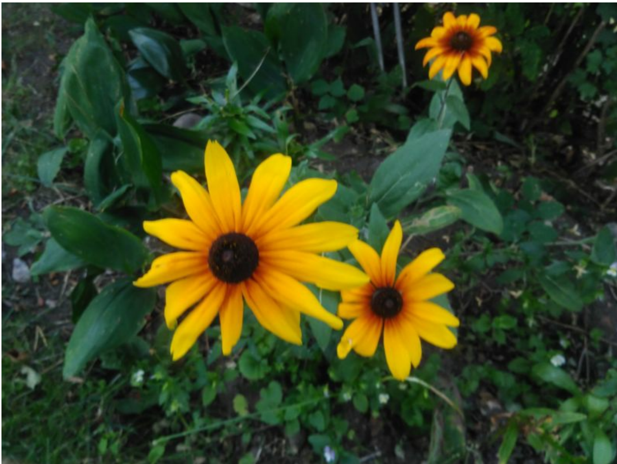
Pildid pole just teab mis kirkad, mida moodsad nutitelefoni teevad, aga dokumenteerimiseks on neist tavaliselt küllalt. Tahvli ekraanil, muide, näevad need isegi paremad ja selgemad välja, kui suurel ekraanil ja tekstid on täiesti hästi loetavad. Loodusfotograafiks muidugi selle tahvliga ei hakka.