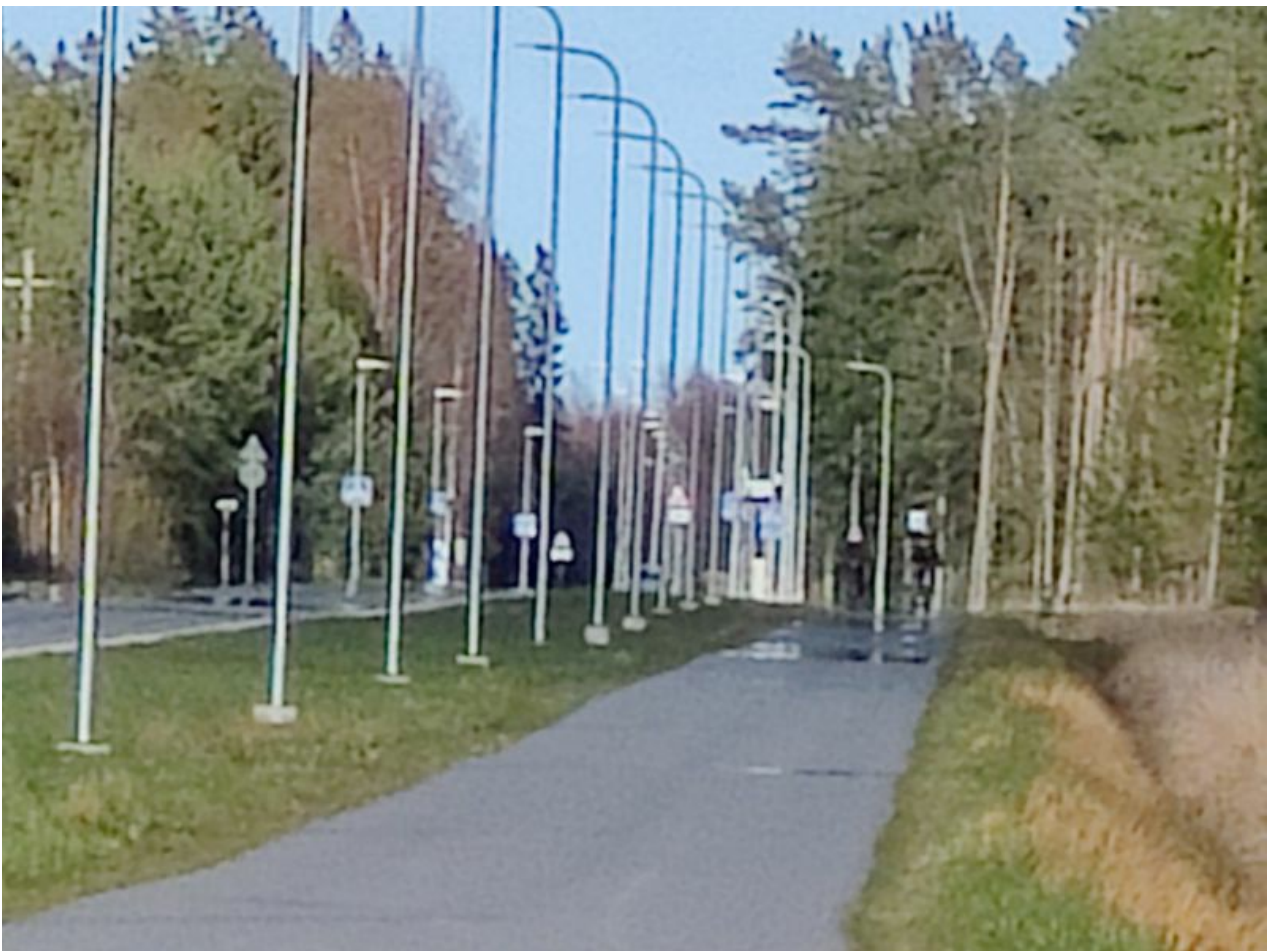
Teleobjektiiviga saab kuni 10-kordse suurenduse, aga see on digitaalne ehk lõigatakse lihtsalt sensori pildist välja.