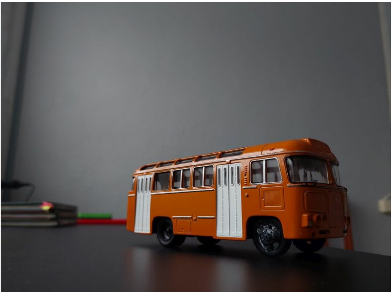
Tubastes tingimustes hämaras - käest pildistades tuleb kehvade valgusolude kohta üsna normaalne pilt.

Kaamera kvaliteet on oma hinnaklassi kohta täiesti korralik ja võimalusi on pildistamiseks igasugustes olukordades portreest öise maastikuni.