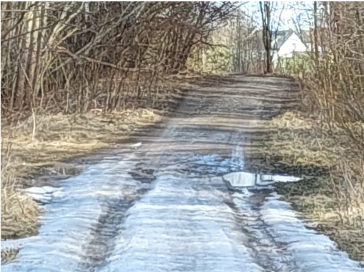
10x suurendusega pole pildiga suurt midagi muud teha, kui lihtsalt infoks vaadata, mis kaugel metsaserval toimub. Teravus on kadunud.