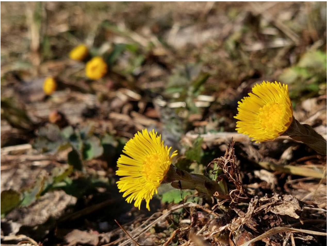
Bokeh-efektil pole viga. Teravate detailide servad on üsna selged.