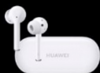
HUAWEI FreeBuds 3i