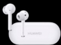
HUAWEI FreeBuds 3i