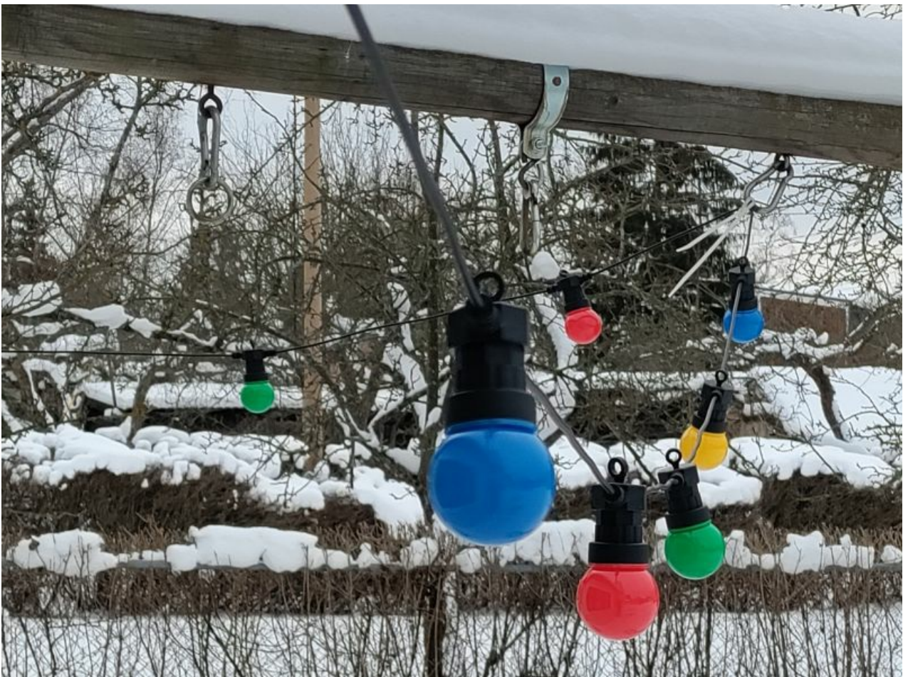
Siin veel üks detail pildist, välja suurendatuna, lumeterad on näha: