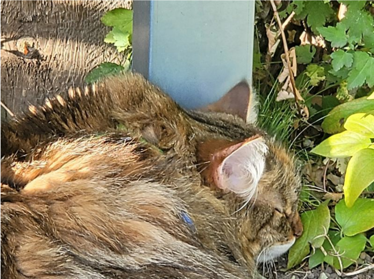
Siin üks väike katse valguses ja varjus, HDR-iga: