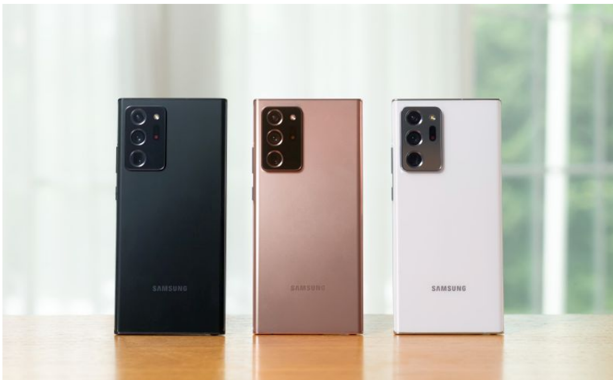
Samsung Galaxy Note20 Ultra.

Korralik müügiedu saatis ka Galaxy Note20 telefoniga samal ajal turule tulnud Galaxy Tab S7 | S7+ tahvelarvutit, mida osteti eeltellimisperioodil 67% rohkem kui eelmise põlvkonna Tab S6 mudelit. Kogu Baltikumis oli kasv lausa 186%.