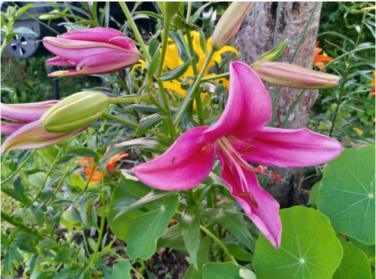
Teravust nagu on, aga ei ole ka.