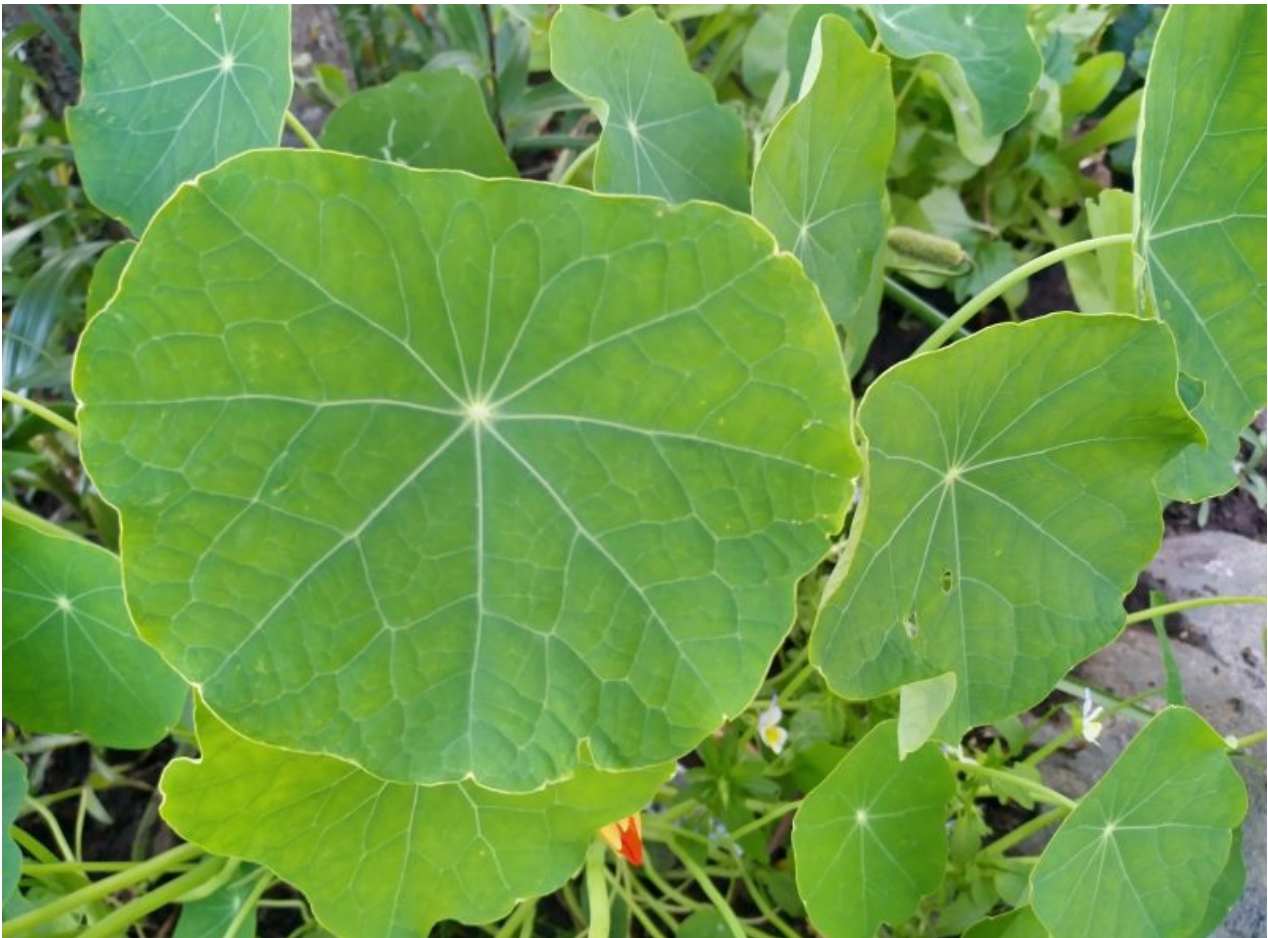
Siin üks 10x suumiga foto: