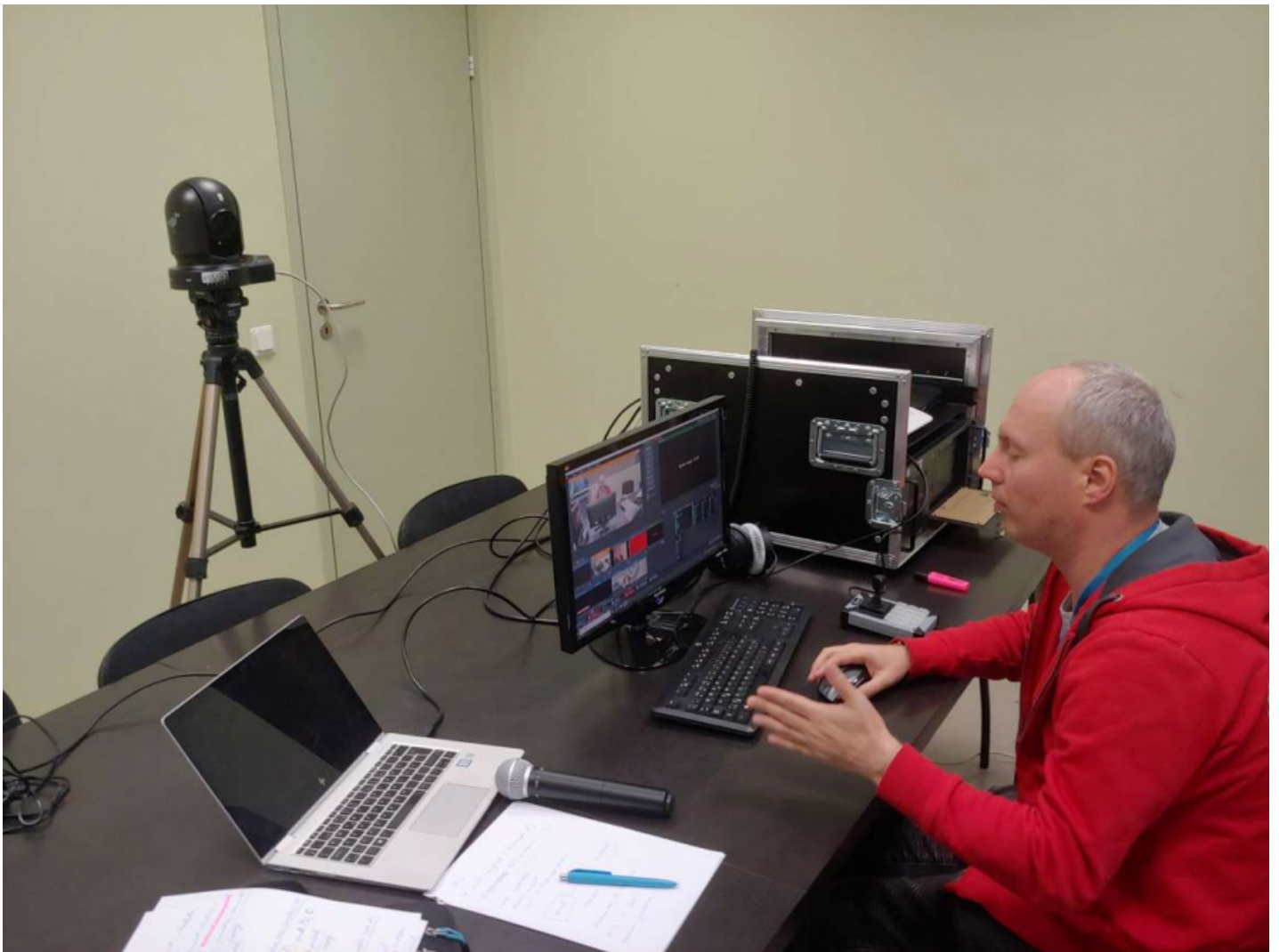
Telejaama juhtimine. Taamal kohver, kuhu kogu tehnika ära mahub.

2+2 reeglile vastava ülekande, nii et muusikudki esinevad erinevates tubades, on koos robotkaamerate ja väga IT-põhise pop-up lahendusega üles pannud Ando Urbas Scalewireless ist.