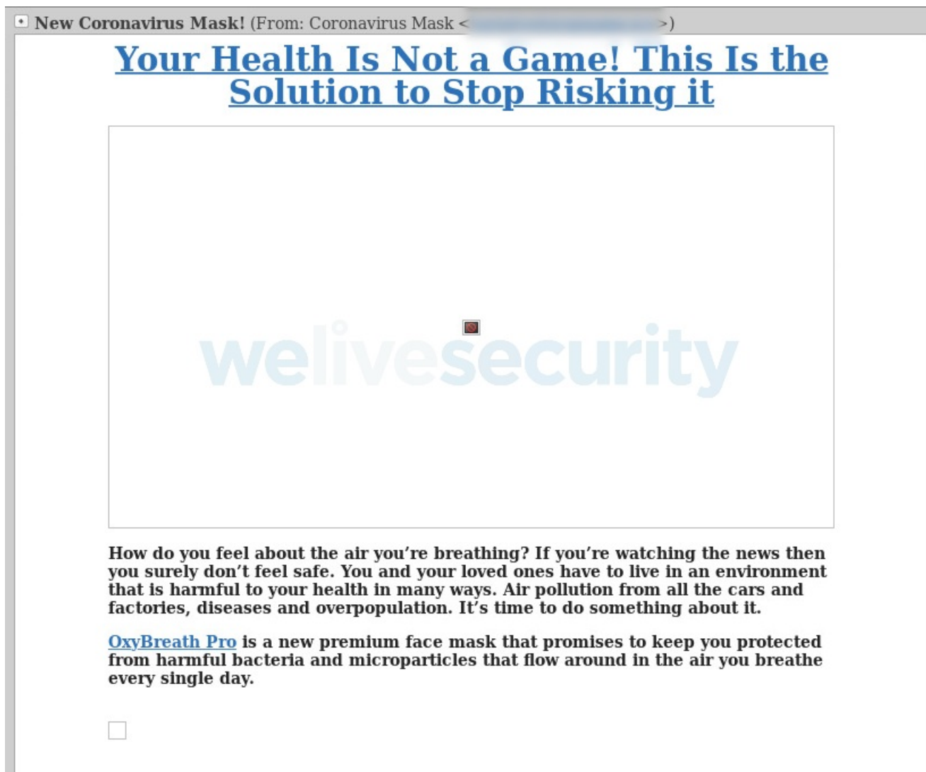
Joonis 4. Petturite näomaskide pakkumised.

Nagu võis ka eeldada, näitab Google Trends, et terminite " kätepuhastusvahendid " ja "näomaskid" otsingumaht on saavutamas enneolematut taset. Kuna nõudlus ületab pakkumist, on ründajad üha enam võtnud sihtmärgiks inimesi, kes soovivad soetada kaitsevahendeid. Sky Newsi andmetel peteti ainuüksi veebruaris Ühendkuningriigis näomaskide "müümisega" inimestelt välja 800 000 naela (üks miljon USA dollarit).