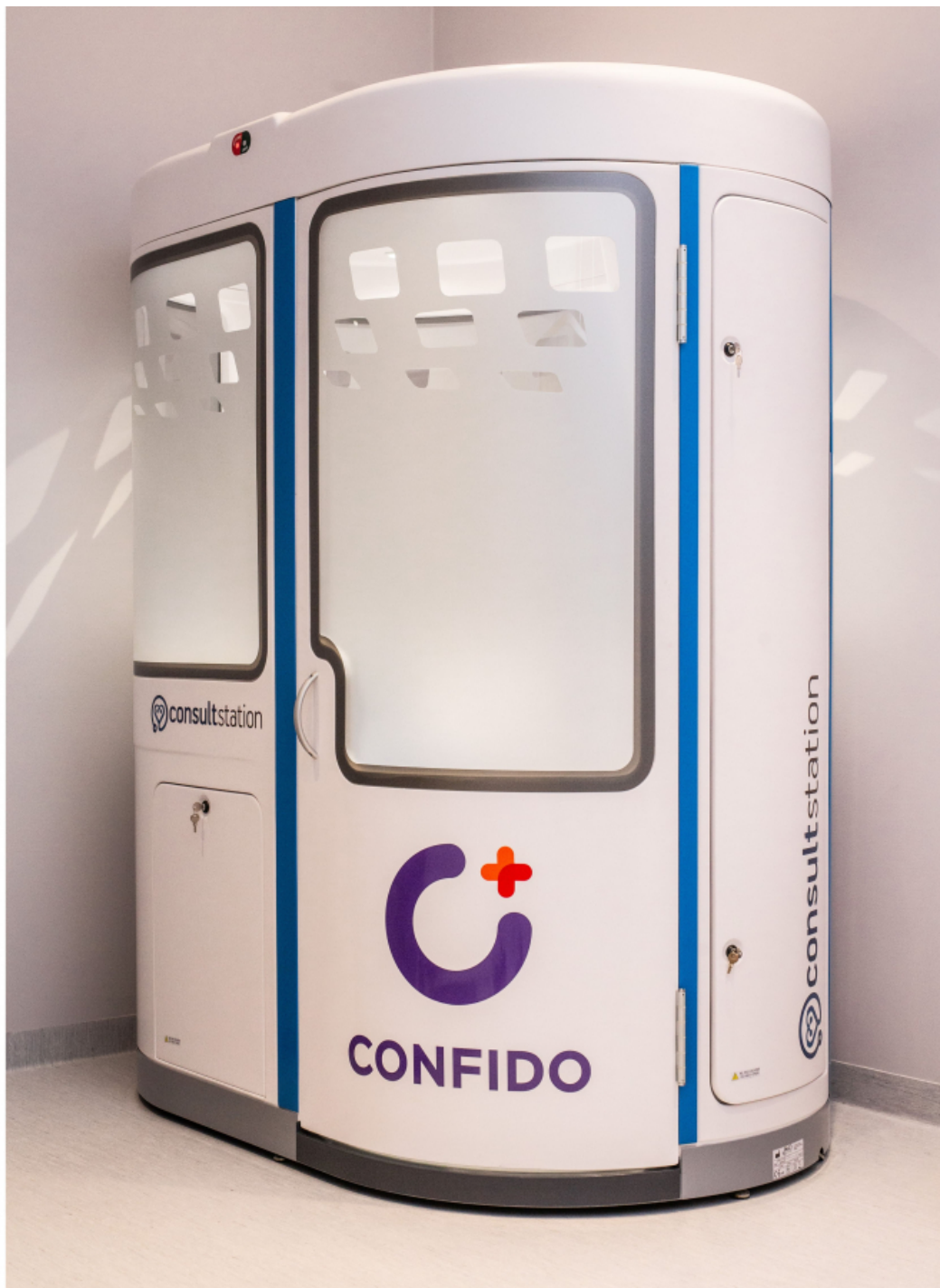
Siia kapslisse tulebki pugeda.

“Confido on valmis digikliiniku teenust pakkuma ka suure töötajate arvuga organisatsioonidele, kes saavad meditsiinikapsli ka oma töökohta paigaldada. Nii saavad inimesed töölt lahkumata teha ise regulaarseid tervisekontrole ning arstilt kiirelt ja mugavalt üle videosilla nõu küsida,” selgitas Laanetu ja lisas, et suurtest ettevõtetest kasutavad digikliinikut näiteks Airbus, Carrefour ja PwC.