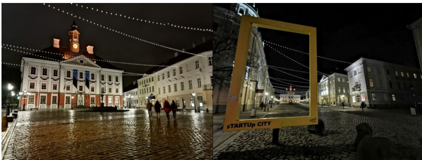
Vasakpoolne P Smart Pro pilt on seekord küll värviderohkem kui eelmine, aga sellist lainurka, nagu Mate 20 Pro'l, testitav telefon öövõttega ei paku.

Üldiselt saab P Smart Pro'ga samuti täiesti korralikke pilte teha, kuid kvaliteedi stabiilsus on kehvem kui tippkaamerateaga - automaatika teeb eksimusi värvide määramise ja teravustamisega rohkem, aga kui teed vanakooli moodi rohkem klõpse samast asjast, siis lõpuks mõne hea kaadri ikka leiab.