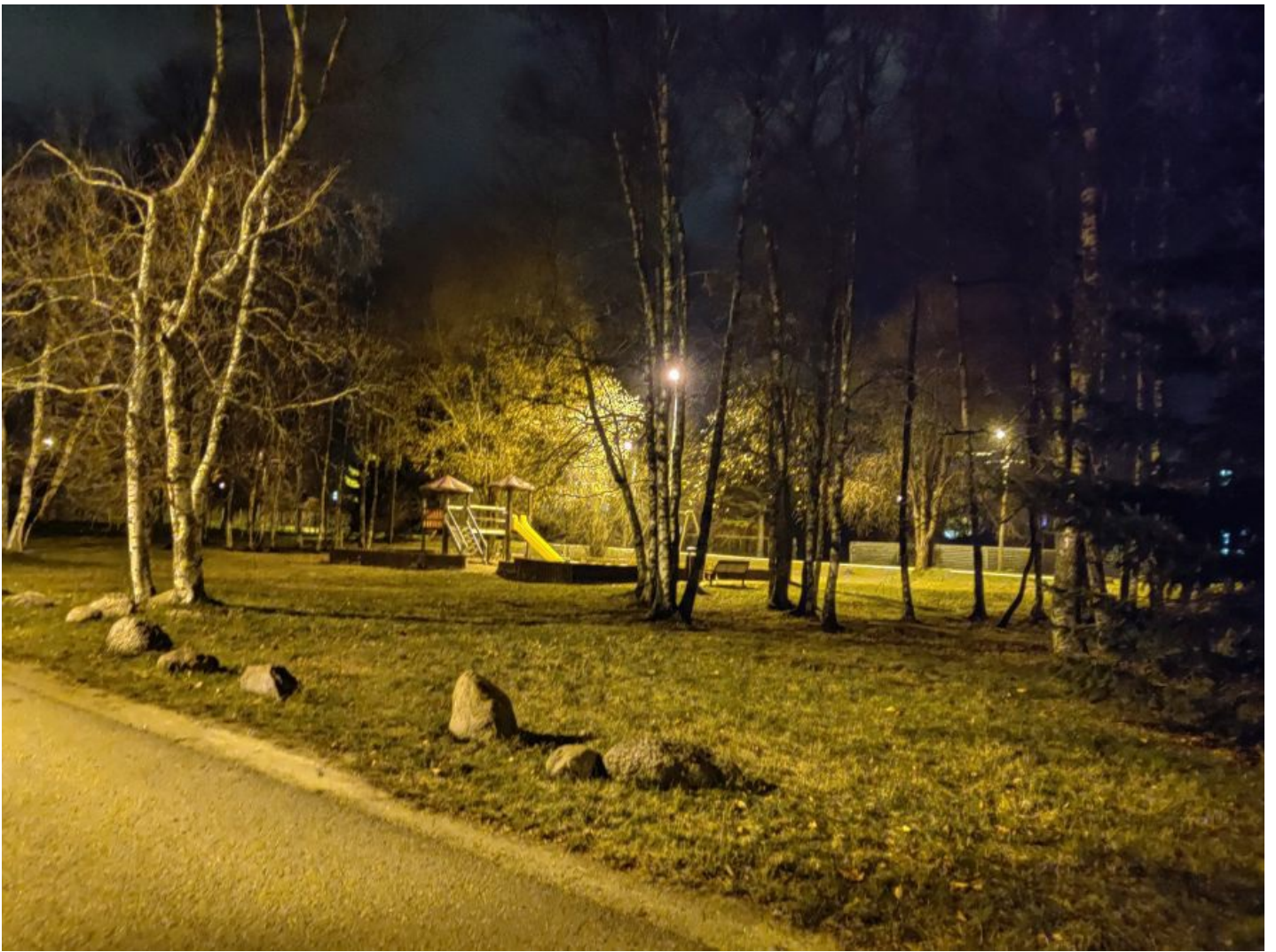
Üks näide tavalisest novembri pilvisest hommikust: