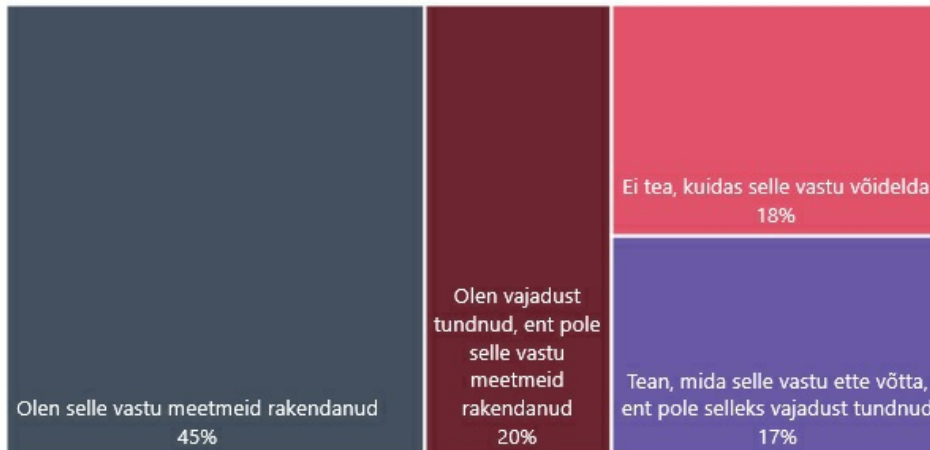
Joonis: Kokkupuuted küberkiusamise ja -ahistamise vastu võitlemisega (% probleemiga isiklikult kokku puutunuist)

Samast uuringust selgus, et 45% nendest kutsekooliõpilastest ja vilistlastest, kellel on küberkiusamisega isiklik kogemus, on selle vastu ka midagi ette võtnud. Teisalt ei tea 18% probleemiga kokku puutunuist, kuidas küberkiusamisega võidelda.