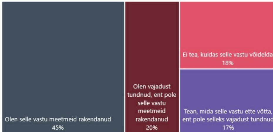
Joonis: Kokkupuuted küberkiusamise ja -ahistamise vastu võitlemisega (% probleemiga isiklikult kokku puutunuist)

Samast uuringust selgus, et 45% nendest kutsekooliõpilastest ja vilistlastest, kellel on küberkiusamisega isiklik kogemus, on selle vastu ka midagi ette võtnud. Teisalt ei tea 18% probleemiga kokku puutunuist, kuidas küberkiusamisega võidelda.