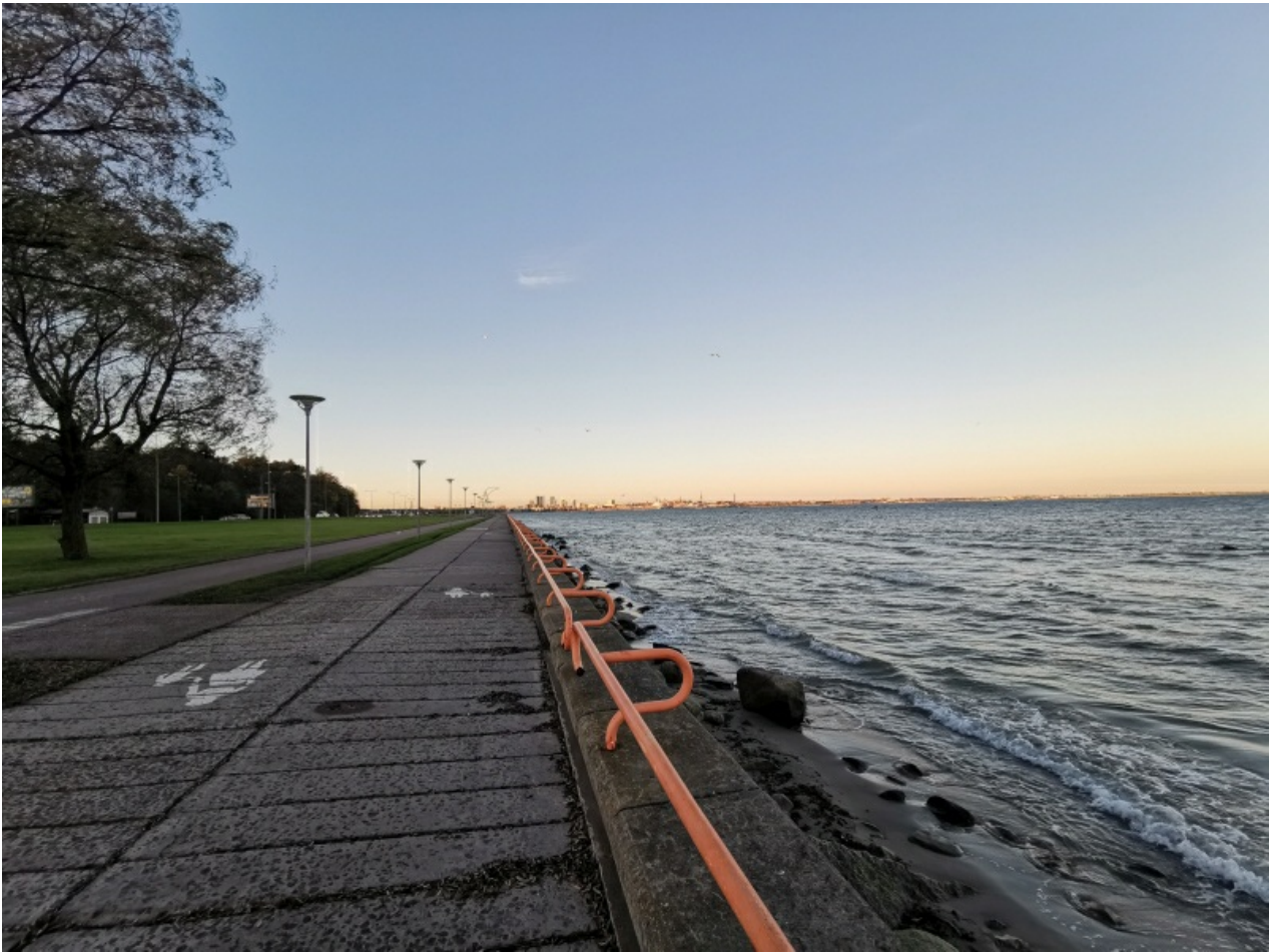
Selle pildi fookuskaugus 35mm ekvivalendiga on 16 mm. Automaatrežiimis valis tehisintellekt säriks 1/143, ava F/2.2.