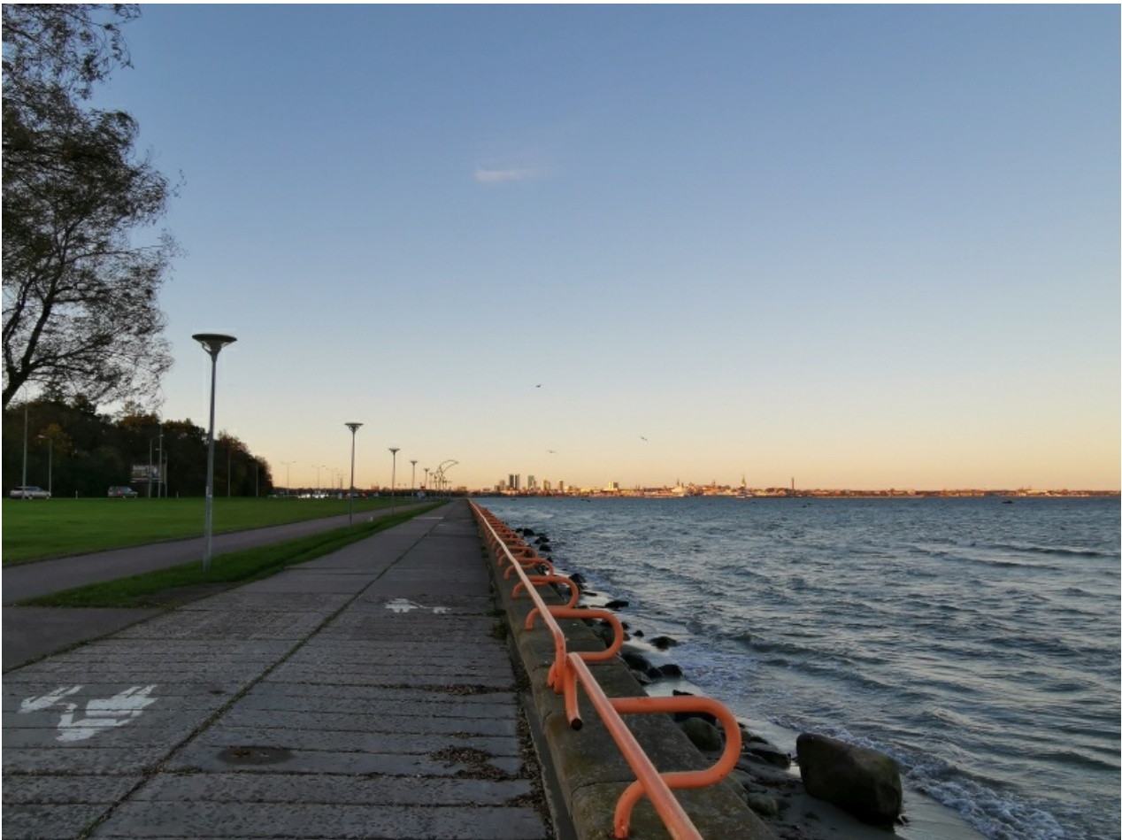
Siin on näha kitsamat vaatenurka, fookuskaugus 35mm ekvivalendiga on 25 mm, säri 1/183, ava F/2.2.