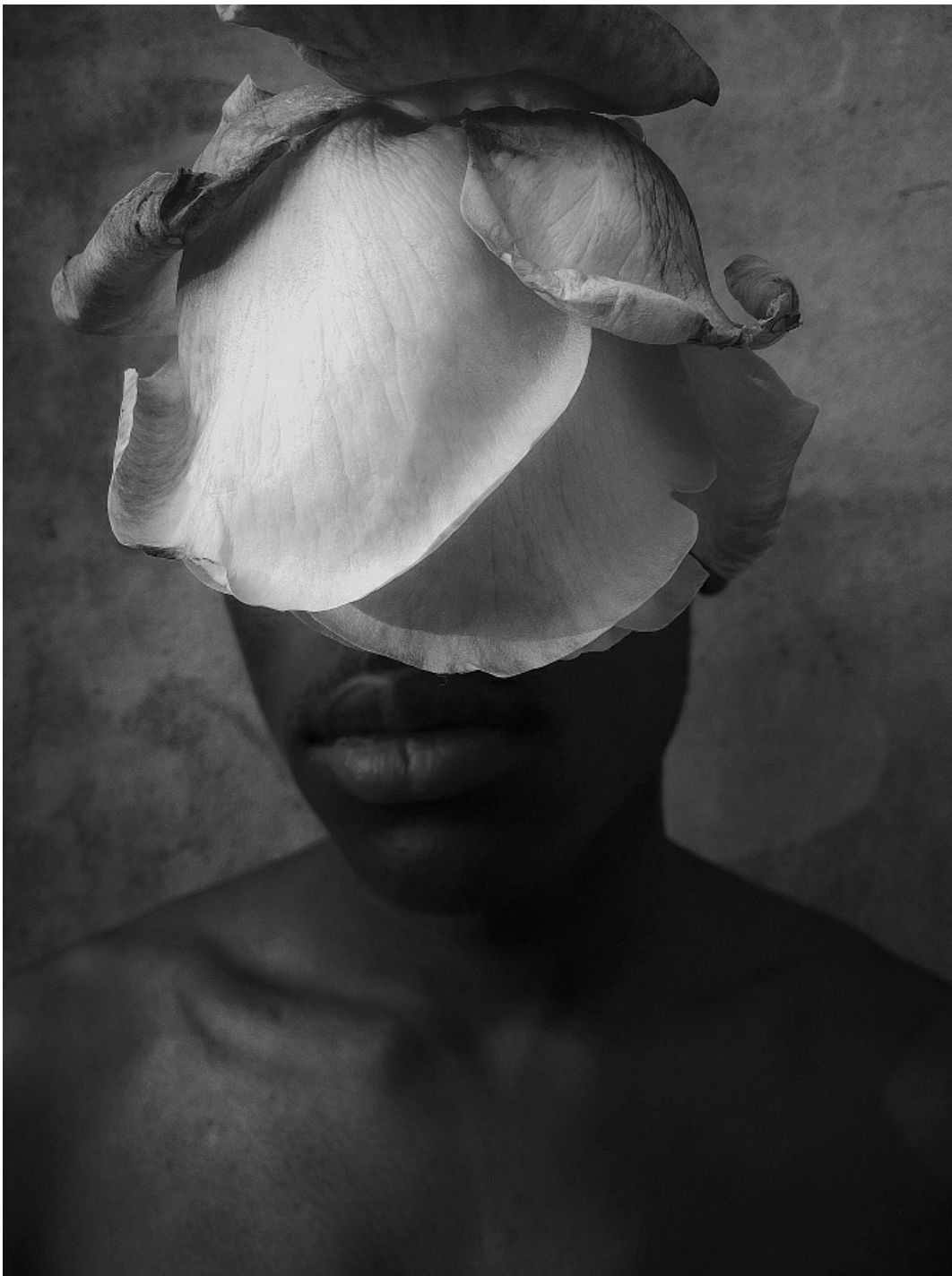
2017 "Me, Myself and I" kategooria võitja La Petite Touche.