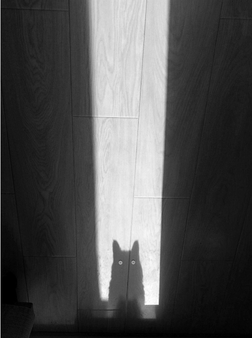
2017. aasta võidutöö, YUZI.

TÄIENDUS: üleslaadimisvormi lähemalt uurides selgus, et mobiilifoto peab olema tehtud Huawei telefoniga, sest kohustuslik on valida mõni Huawei mudel (või "Other" Huawei seade).