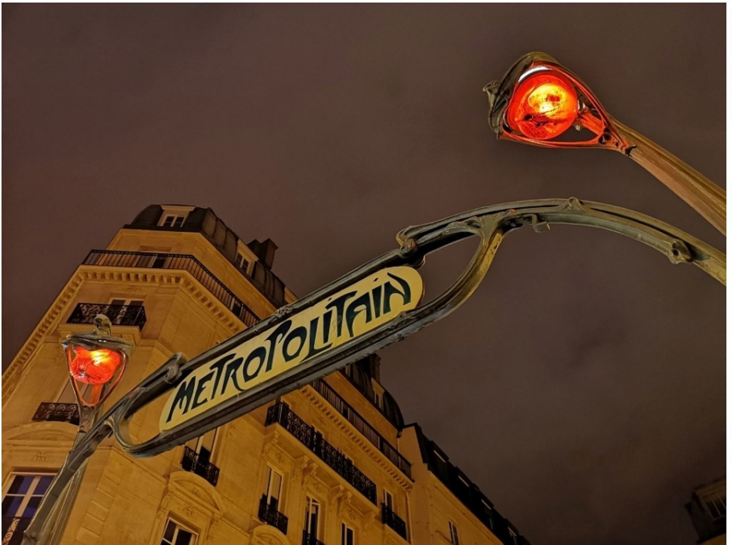
Huawei P20 Pro-ga Pariisis üsna pimedates oludes tehtud pilt.

Tehisintellekti stabiliseerimise funktsioonist on abi ka pimedas pildistamise puhul. Huawei P20 Pro nutitelefoni 40-megapiksline sensor on suurima pikslite arvuga tänaste nutitelefonide seas ning telefoni kolmekordse optilise suurendusega objektiiv, äärmiselt tundlik pildisensor ja 4D ennustav fookus võimaldavad tabada üliväikseid detaile ka öösel pildistades.