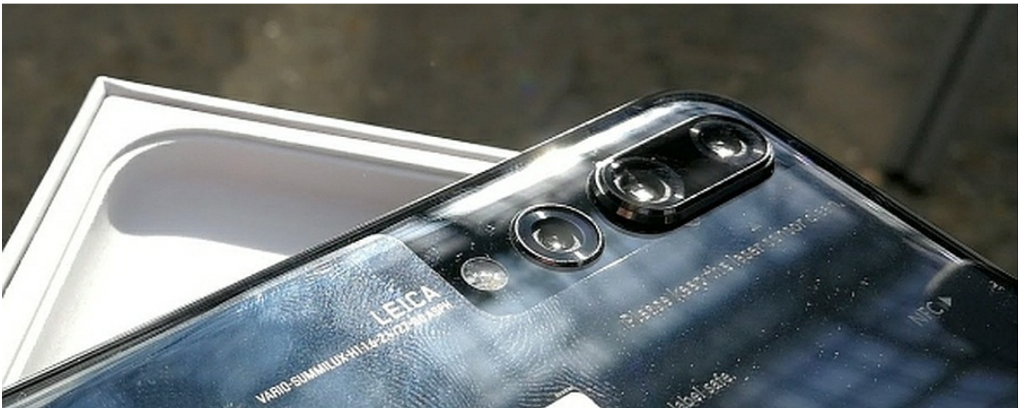
Ongi karbist väljas ja esimesed (kellegi) sõrmejäljed peal. Huawei P20 Pro, tagaküljelt kolmesilmaline.