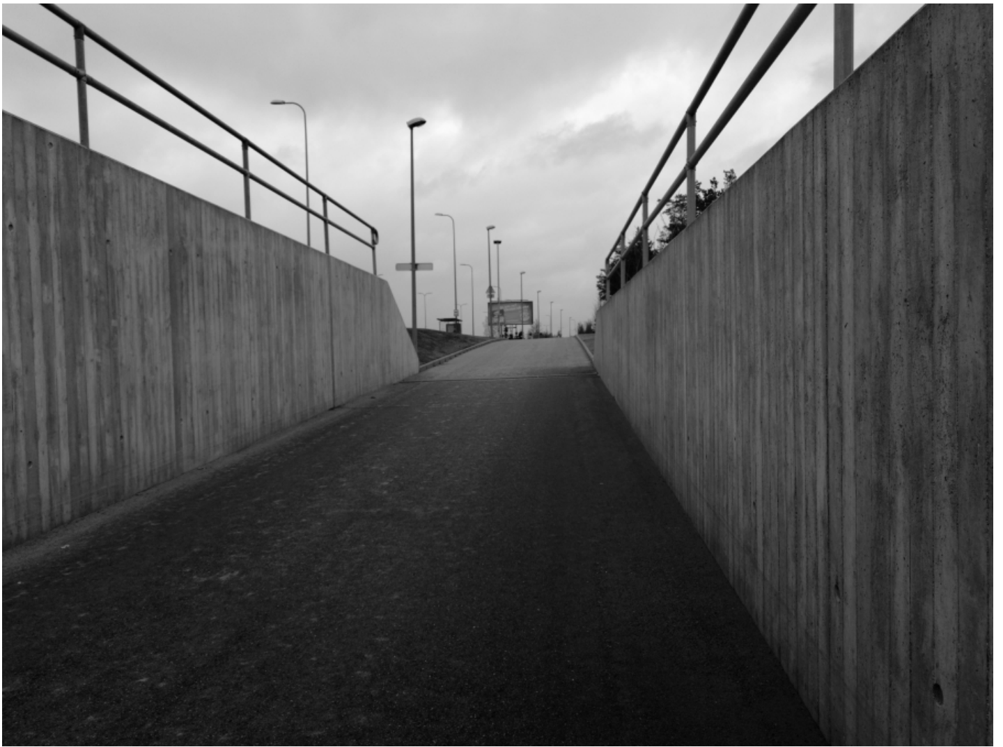
Tehtud mustvalge sensoriga.