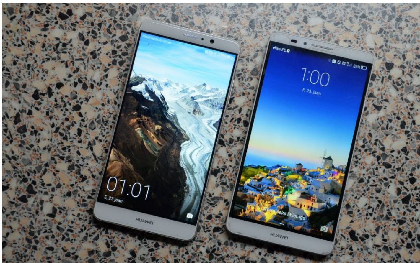
Vasakul Huawei Mate 9, paremal Huawei Mate 7. Sarnasus on ilmne.

Raske, metallkorpusega telefon on vana tuttav - millegipärast pole Huawei selle disaini muutnud eriti ei üle-eelmise põlvkonna Mate 7 ega ka eelmise, Mate 8 puhul. Ikka sama kuju, peaaegu samad nupud ja kergelt kumer alumiiniumist taga kaas. See meenutab veidi Oneplus'i telefone.