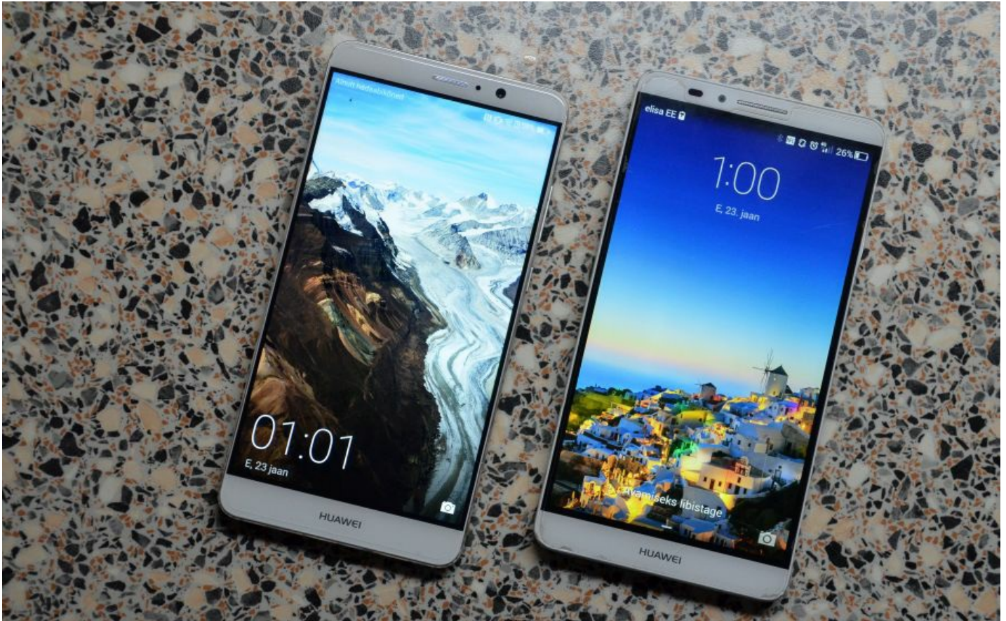
Vasakul Huawei Mate 9, paremal Huawei Mate 7. Sarnasus on ilmne.

Raske, metallkorpusega telefon on vana tuttav - millegipärast pole Huawei selle disaini muutnud eriti ei üle-eelmise põlvkonna Mate 7 ega ka eelmise, Mate 8 puhul. Ikka sama kuju, peaaegu samad nupud ja kergelt kumer alumiiniumist tagakaas. See meenutab veidi OnePlus'i telefone.