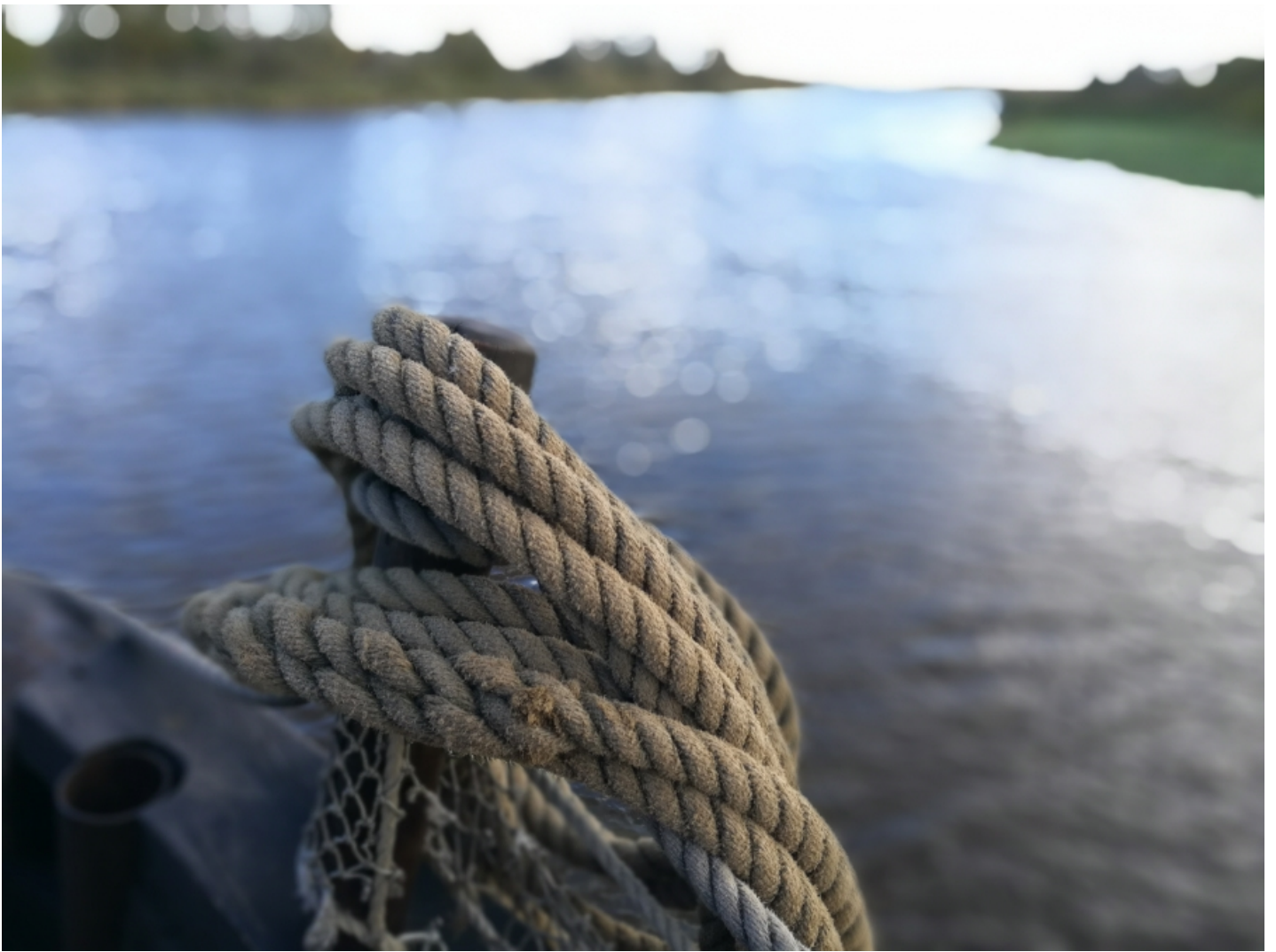
Järeltööluses on ava maksimaalselt lahti keeratud. Lodi Jõmmu Emajõel.