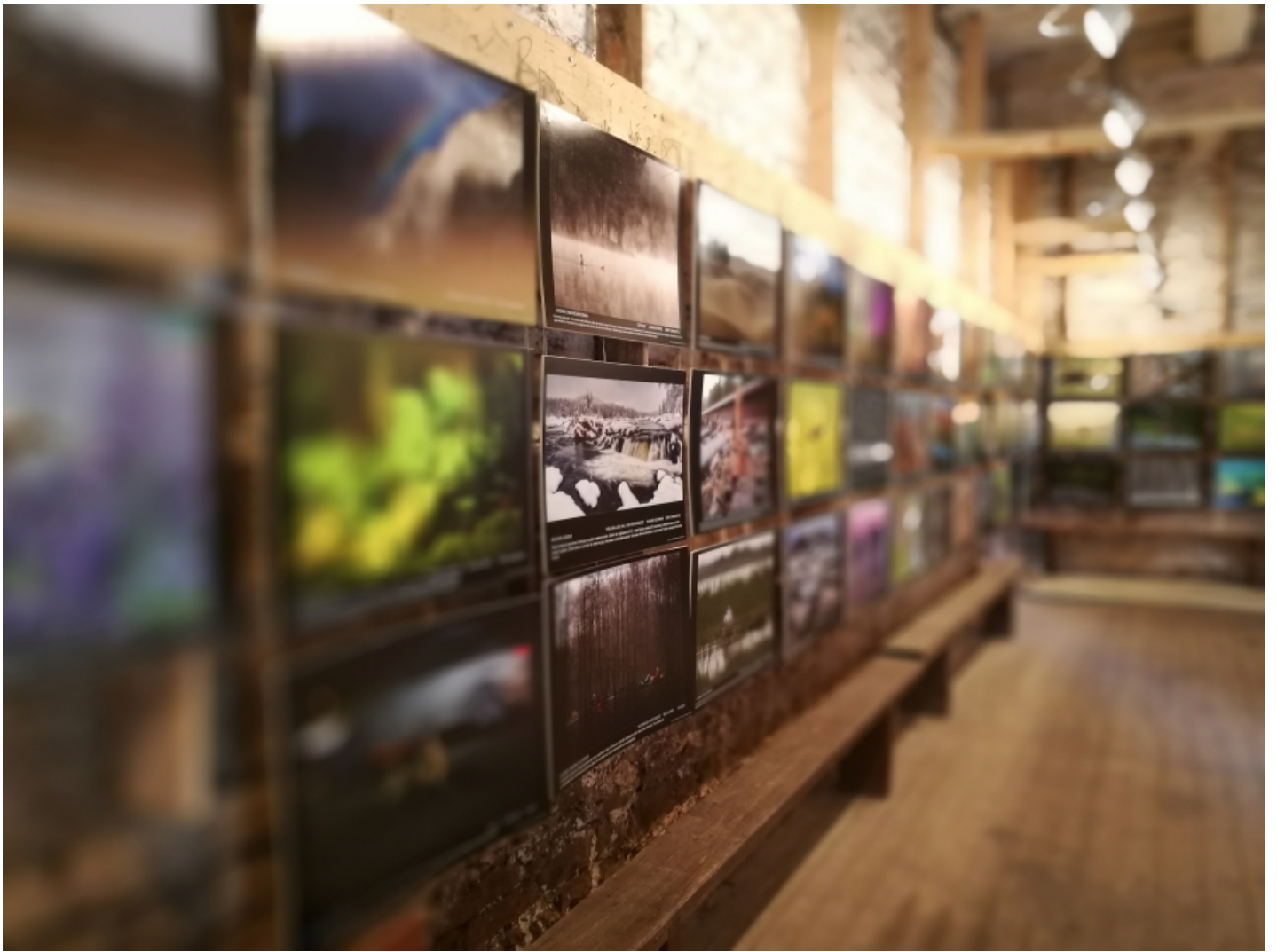
Pildilt on näha tarkvaraline teravuse töötlemine. Kaugelt on ava suurendamise emuleerimine natuke tehisklik.