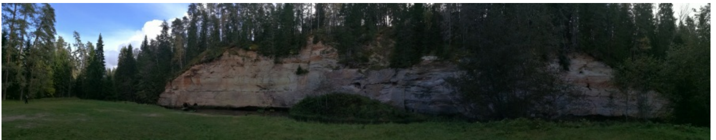
Pidev Taevaskoja panoraam - Honor 8 teeb, nagu uuematele andoiditefonidele kohane, panoraami pidevalt rida rea järgi lisades, et katkestusi ei tuleks.