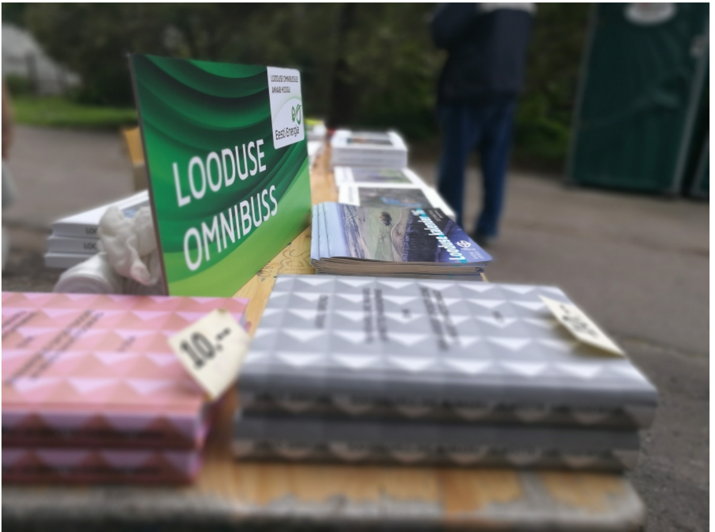
Veel üks näide väikseks keeratud teravussügavusest. Pildil klikkides näeb originaali.