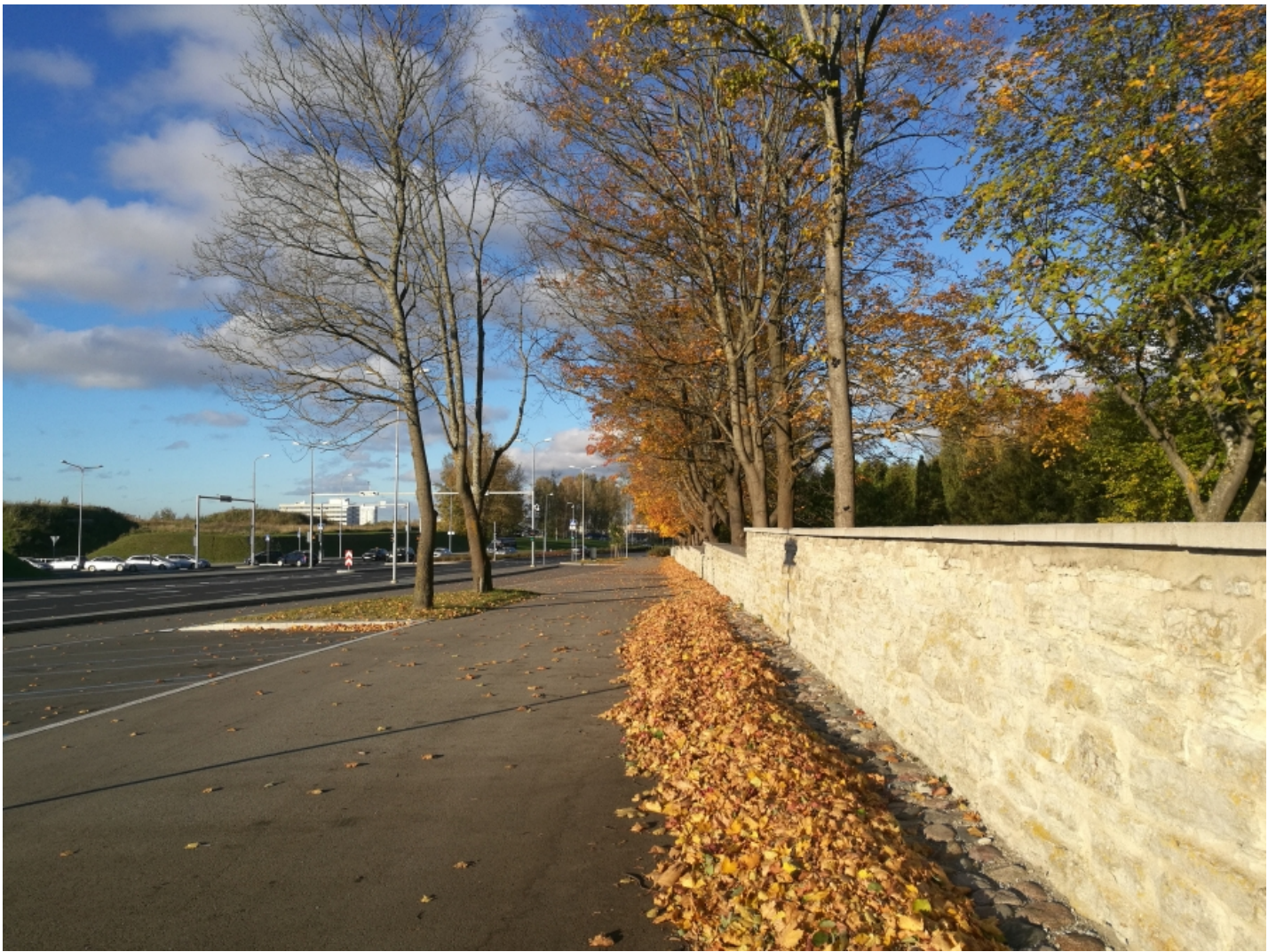
Pilt eredas sügises - taevas ja värvid tuakse välja.