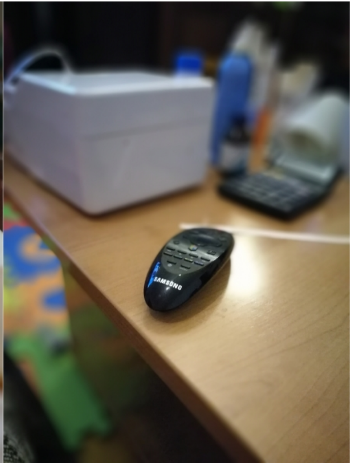
Lähedalt pildistades on bokeh-efekt täitsa usutav.