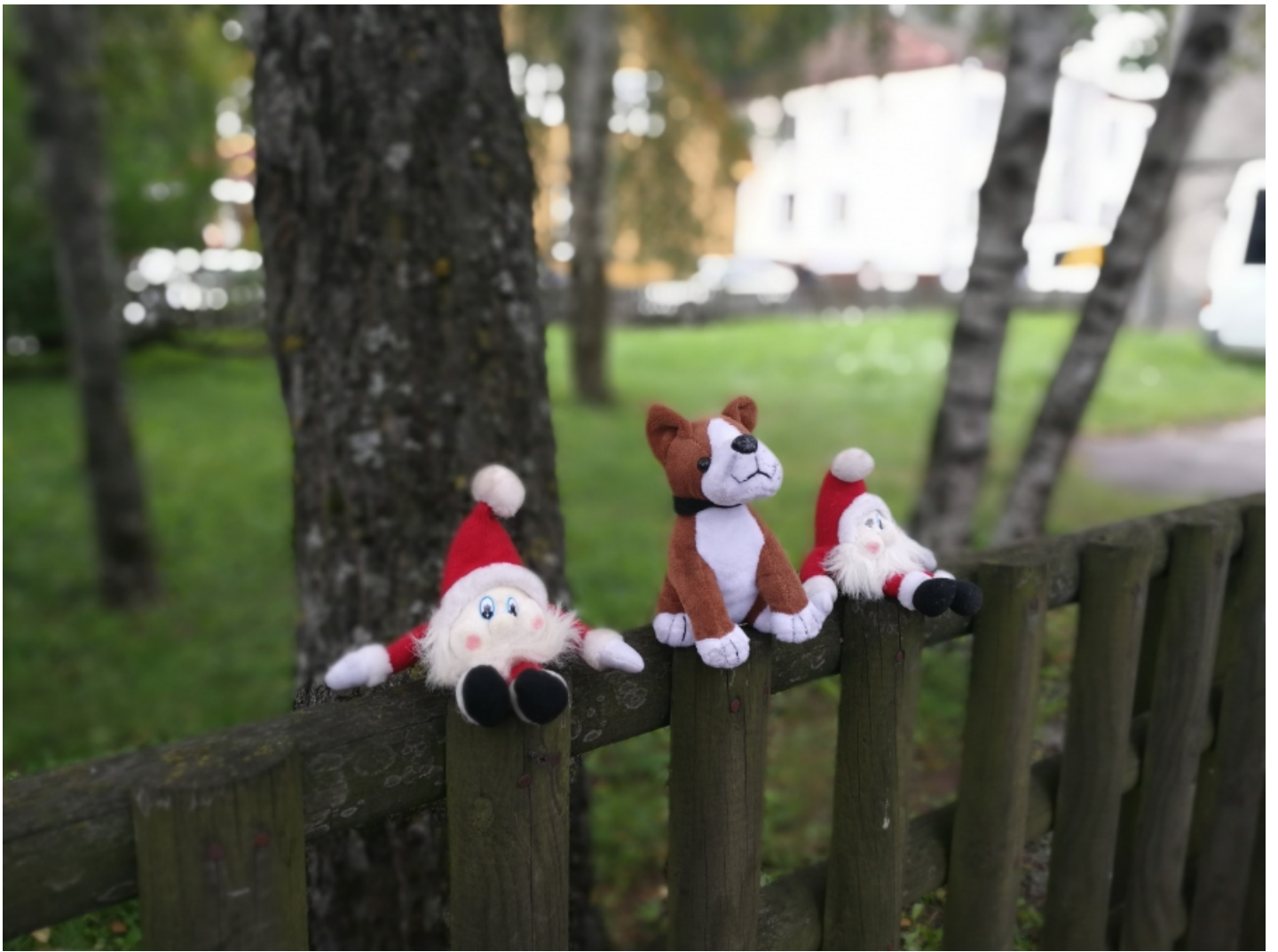
Õues, suure avaga. Klikkides pildil näeb originaali.