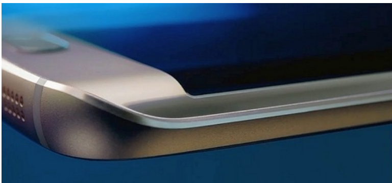
Pildid: kaadrid Galaxy S6 esitluselt Barcelonas

Mõnedes riikides tuleb Galaxy S6 ja S6 Edge müügile 10. aprillil, kogu maailmas pisut hiljem. Hind tuleb kalleimasse otsa, kumerate servadega Edge'i kalleimate mudelite hind ületab isegi 1000 euro piiri.