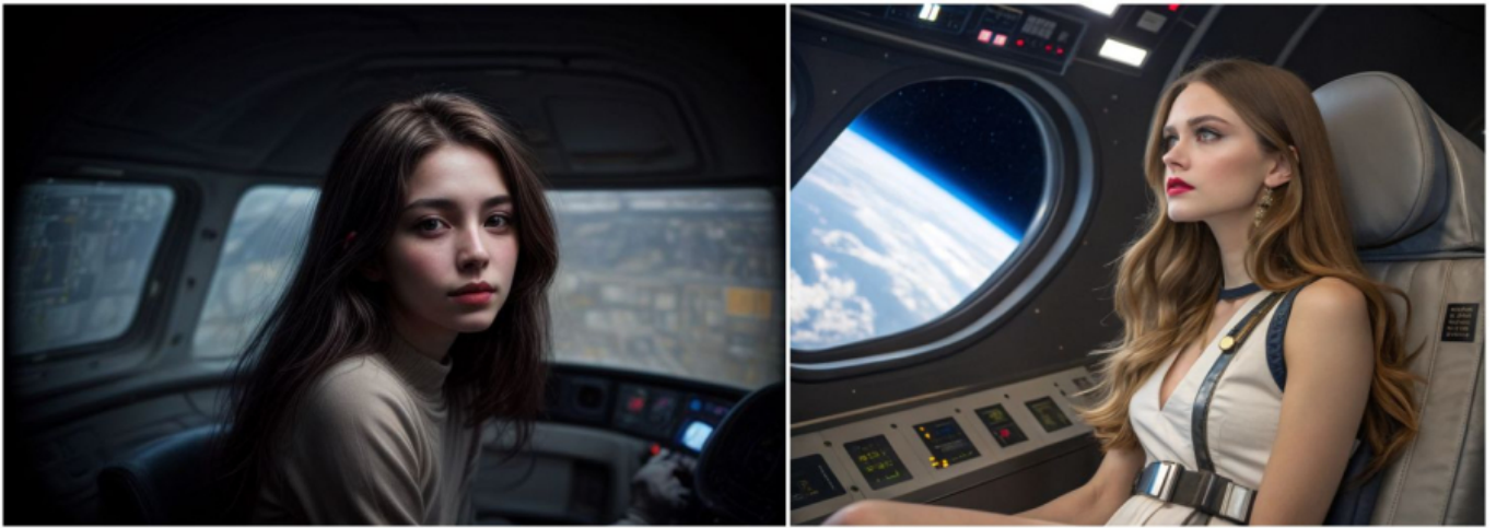
Ülim fotorealism: vasakul Civitai näide vastava mudeliga, paremal Recraft AI.

Recraft töötab tellimuspõhisel mudelil, mis sisaldab tasuta taset piiratud igapäevaste krediitidega. Tasulised plaanid algavad kümnest eurost kuus, pakkudes täiendavaid krediite ja funktsioone, mistõttu on see taskukohane lahendus nii juhuslikele loojatele kui ka proffidele igapäevatöös.