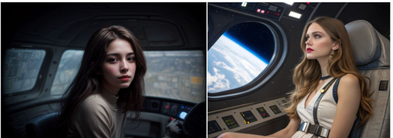
Ülim fotorealism: vasakul Civitai näide vastava mudeliga, paremal Recraft AI.

Recraft V3 on läbinud mitmeid võrdlusteste ja saavutanud Hugging Face'i platvormil ELO reitingu 1172, mis asetab selle konkurentidest nagu Flux ja Ideogram kõrgemale. See tulemus peegeldab Recraft V3 suutlikkust luua kvaliteetseid pilte, mis vastavad kasutajate ootustele. Nii nagu teised mudelid, pakub ka Recraft erinevaid stiile pliatsijoonistustest ülima fotorealismini.