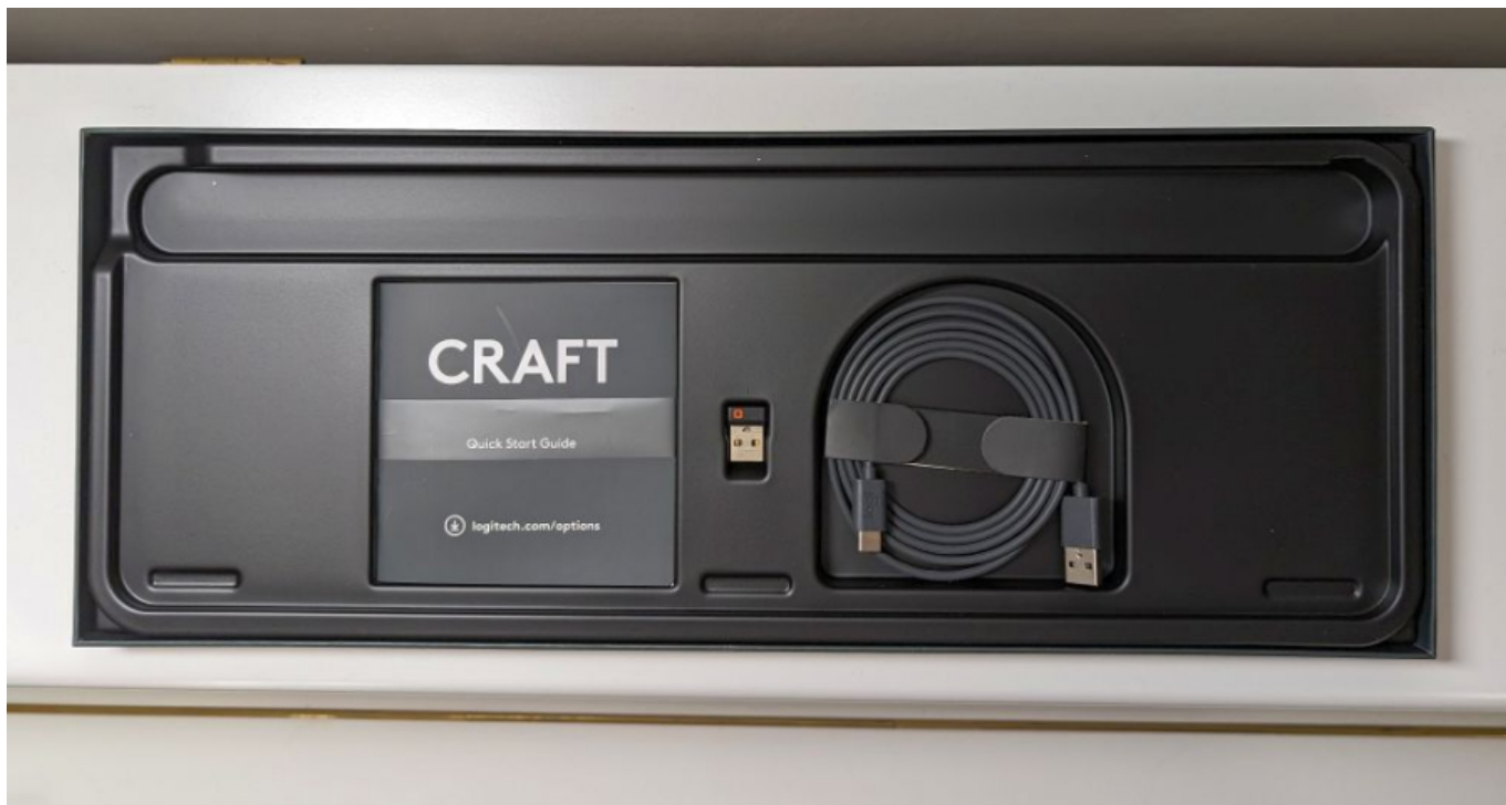
Lahtipakkimine. Kaasas on adapter, USB kaabel ja juhend.

Iseenesest ongi tegu üsna tuttava tootega - Logitech MX Keys S oli juba meie testimislaual ja see uus ongi üsna üks-ühele sama, kui uus Craft, kuid mõne erinevusega.