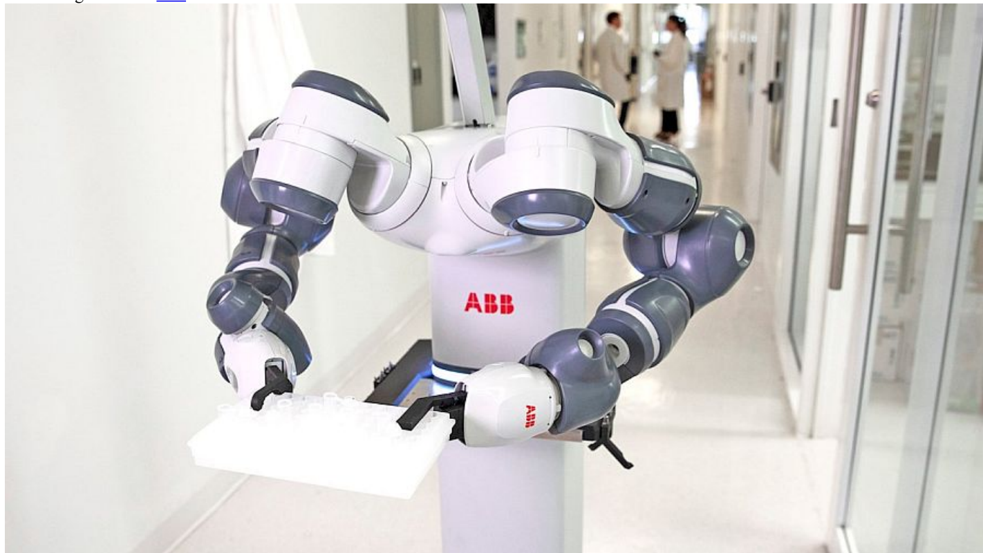
ABB Grupp alustas järgmise põlvkonna autonoomsete mobiilrobotite arendamisel koostööd startup firmaga Sevensense Robotics, kes on juhtivaid tehisintellekti (AI) ja 3D visuaaltehnoloogiate pakkujaid.

Sevensense'i tehisintellekti ja navigatsioonitehnoloogia integreerimine võimaldab tulevastel autonoomsetel mobiilrobotitel (AMR) töötada dünaamilisemates struktureerimata keskkondades. Tehnoloogia pakub klientidele enneolematut paindlikkust, kuna mobiilsed robotid saavad iseseisvalt navigeerida keerulistes, dünaamilistes siseruumides ja väliskeskkonnas inimeste läheduses.