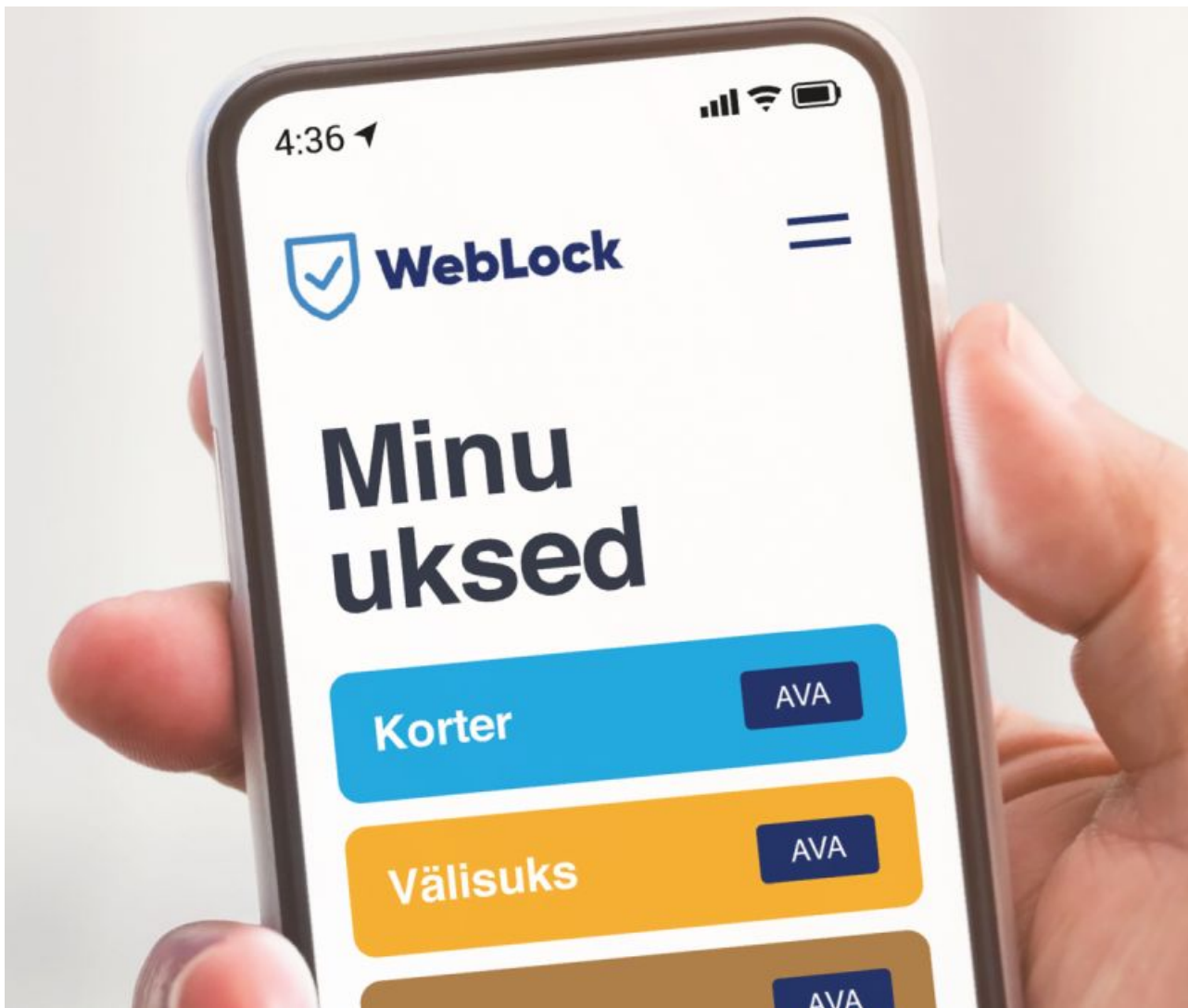
Valnese Weblocki äpp.

Lisaks kasutatakse sarnaseid nutilukke näiteks spordiväljakutel Paines ja Pärnus ning erinevate ehitusobjektide läbipääsuvärvates, et tagada alale täielikult automatiseeritud ligipääs.