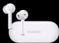
HUAWEI FreeBuds 3i