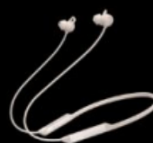
HUAWEI FreeLace Pro