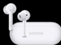
HONOR Magic Earbuds