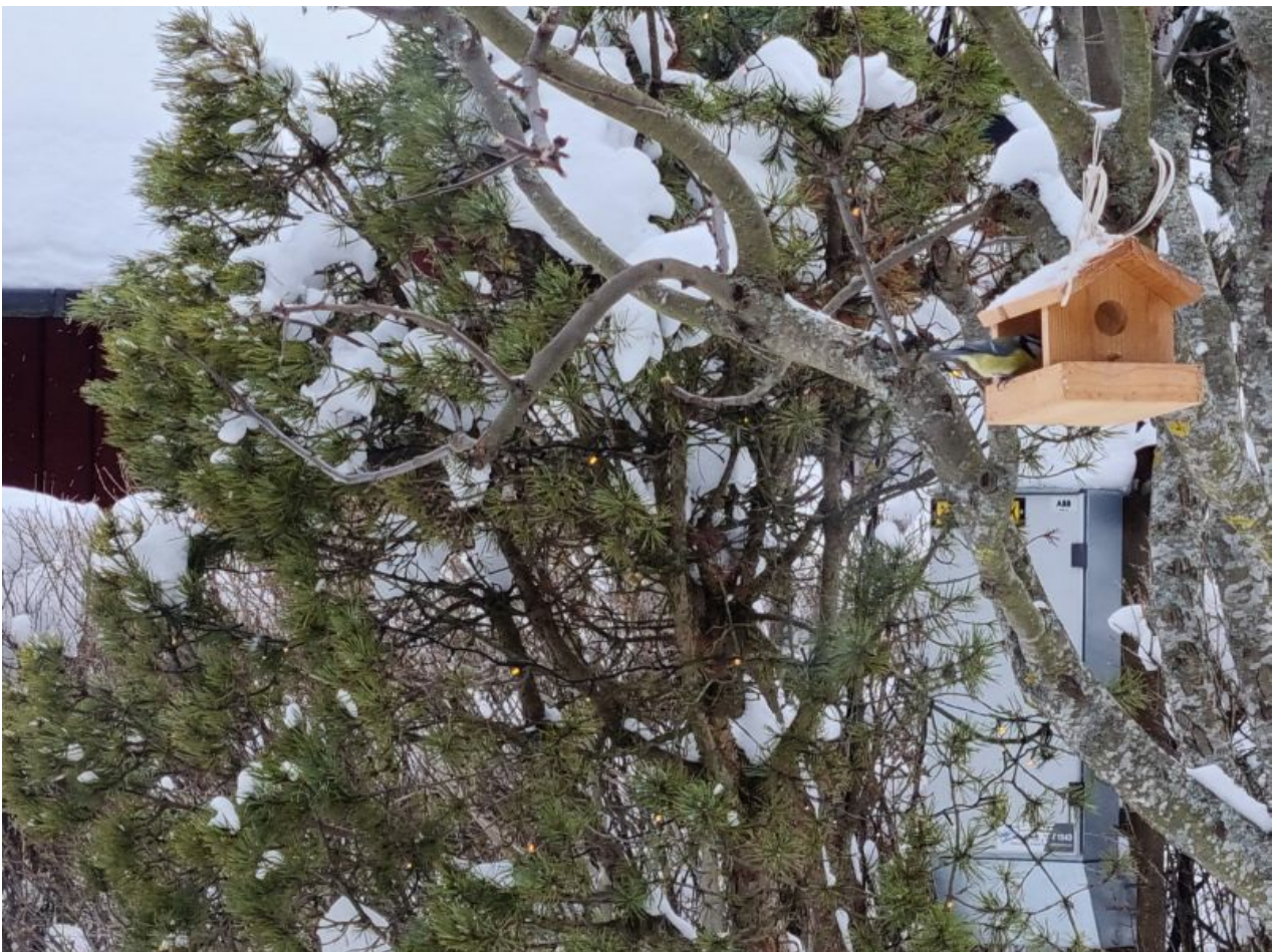
Kaameraga saab ka videot teha kuni 8K formaadis. Videost saab vajadusel välja võtta üksik-kaadri, mille kvaliteet on tavalisele fotole üsna sarnane. Mobiili peab ainult üsna kindlalt paigal hoidma filmimise ajal või veel parem - kasuta statiivi.