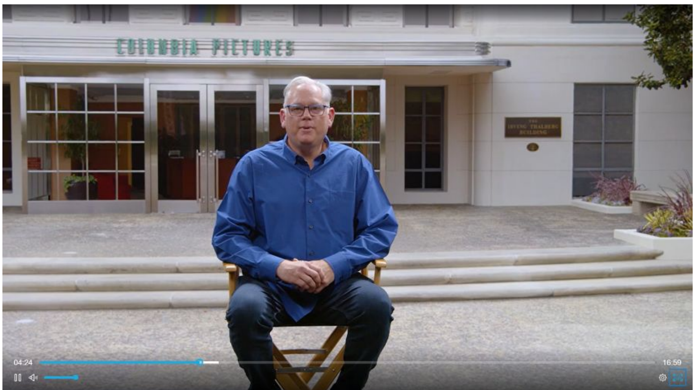
Sony pikkis oma pressiesitluse rääkijate vahele varem valmis tehtud videoid. Sony on meelelahutusmaailmas heal positsioonil: ühelt poolt arendab meelelahutustehnikat proffidele, kes oma loomingut üles võtavad ja teiselt poolt pakub kasutajatele lõpptarbija seadmeid, mis proffide visiooni võimalikult täpselt edasi annaksid. Seega kogu protsessist on ülevaade ja kõik on algusest lõpuni kontrolli all.