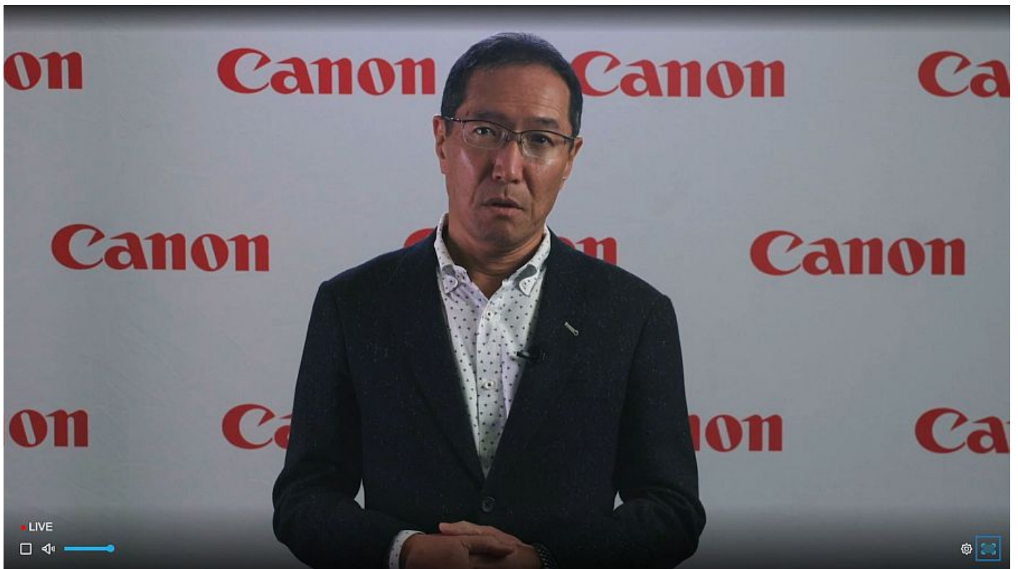
Canon tegi pressiesitluse traditsioonilises "rääkivate peade" stiilis. Korraks näidati ka EOS R6 kaamerat.