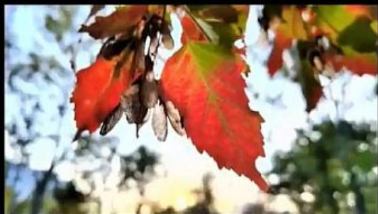
Mate 40 Pro