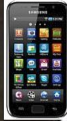
AlcoGait (Smartphone sensing)