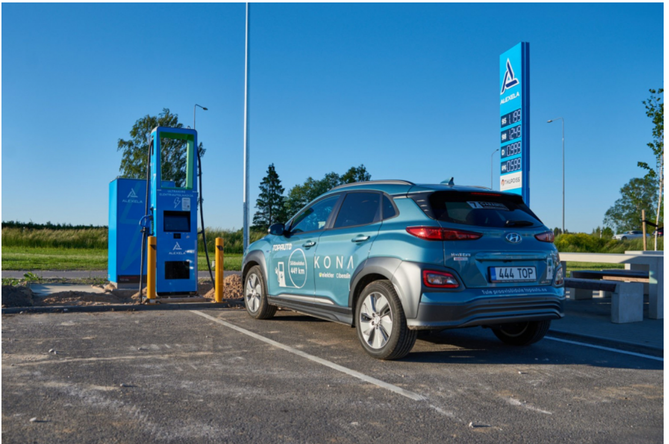
Hyundai Kona Electric Imavere Tikupoisi 150 kW “pumba” küljes

Nii et koju jõudes oli mul mõnusasti akumahtuvust järel, kogu reis oli täiesti stressivaba (kui Tallinnas esialgne optimistlik Elmode vahel jooksmine välja arvata) ja ma jõudsin niiii lähedale, et seda autot Topautole üldse mitte tagasi anda. Sest ta lihtsalt meeldis mulle.