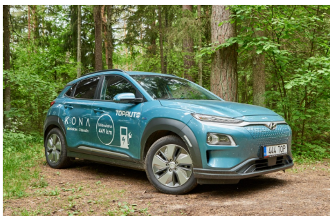
Kona Electric näeb mõne nurga alt isegi veidi agressiivne välja

Veeldatud dinosauruste asemel elektri abil liikuv Kona eristub oma fossiilsetest suguvendadest siiski märgatavalt. Välimikus on suurim erinevus ninas – elektrilisel Konal ei ole õhuvõre ning nina on voolujoonelisuse nimel bensiinisõõdikuga võrreldes märgatavalt muudetud. Ka veljed on õhutakistuse vähendamise nimel suhteliselt kinnised, kuid pidurite ventileerimiseks lastakse neile õhku peale ninas olevate avade kaudu.