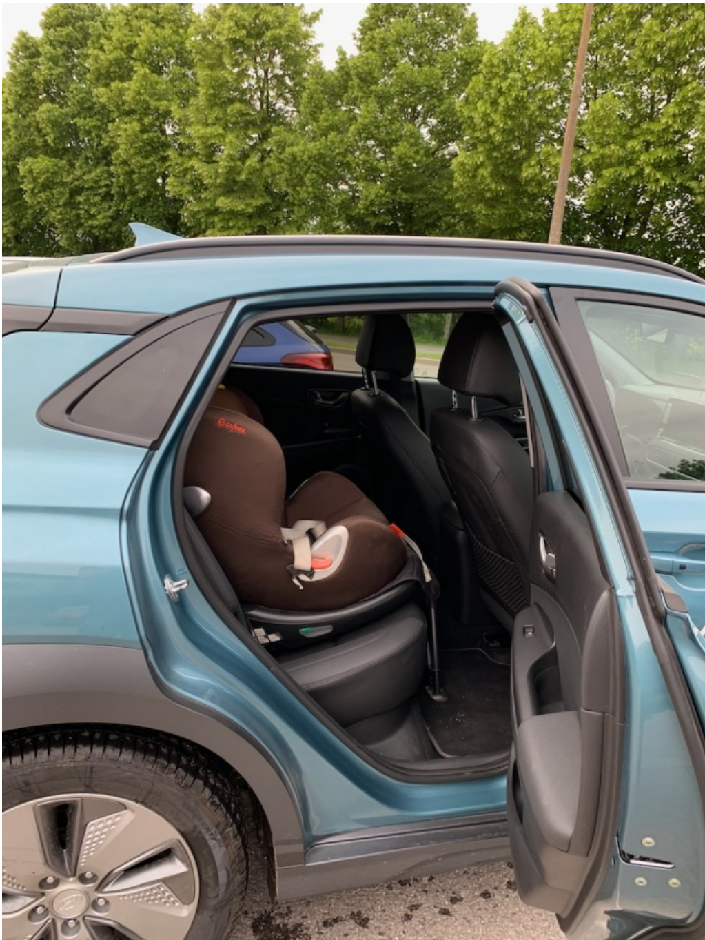
Lasteiste mahub auto tagaistmele kenasti ära ja jätab ruumi ka eesistujale, erinevalt näiteks Renault Zoe'st

Erinevalt veeldatud fossiilide luristavatest velledest on elektriautot võimalik "tankida" ka kodus, mis ongi kõige soodsam ja mugavam variant – tuled õhtul koju, paned saba seina ja hommikul võtad soojaks kõetud ja täis laetud akuga auto. Selleks saab koju seinale paigaldada ka võimsamad 3-faasilised laadijad, mis aga kortermaja elanikele üldjuhul kättesaadav võimalus ei ole. Kodused laadijad maksavad ca 500-1500 euro vahemikus, olenevalt sellest, kui suurt võimsust ja kui palju nutikust sul sinna sisse vaja on.