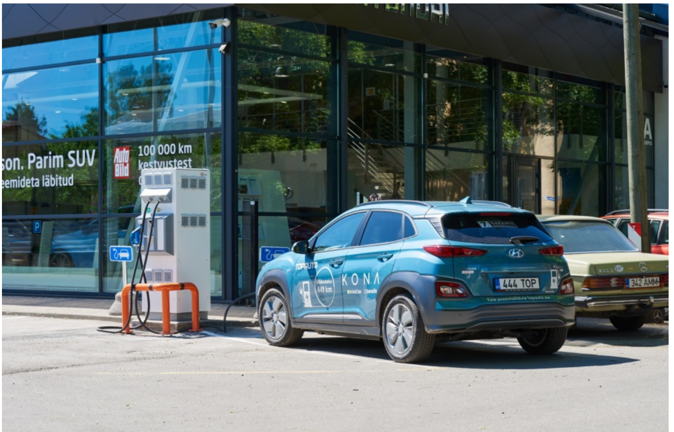
Hyundai Kona oma Tallinna kodu ees laadimas

Õnneks siiski on lausa kaks ettevõtet konkurentsi viljastava mõju tingimustes arendama hakanud ka päris kiirlaadijate võrgustikku, kust saab julgelt 50 kW laadimisvõimsust kätte ning mis kasvab praeguseks jõudsasti. Nii et lõpuks jõudsin täiesti ette planeerimatult Tallinna Topauto kõrval oleva kiirlaadija juurde. Laadimine 23-lt protsendilt 80-ni võttis aega täpselt niikaua, kui Topautost Endla Circle K-sse jalutamine, seal burksi söömine ja tagasi jalutamine. Ca 50 minutit.