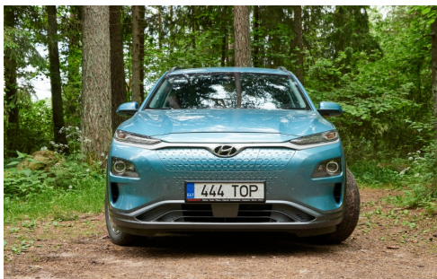
Elektrilisest südamest annab aimu see sile esiots. Muuseas, kõik ventilatsiooniavad on päris, mitte butafooria