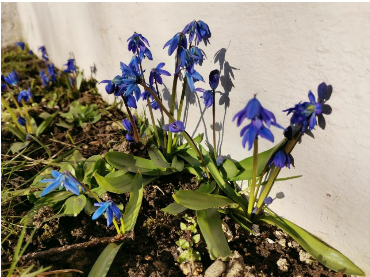
Siin üks näide ka bokeh 'ist: