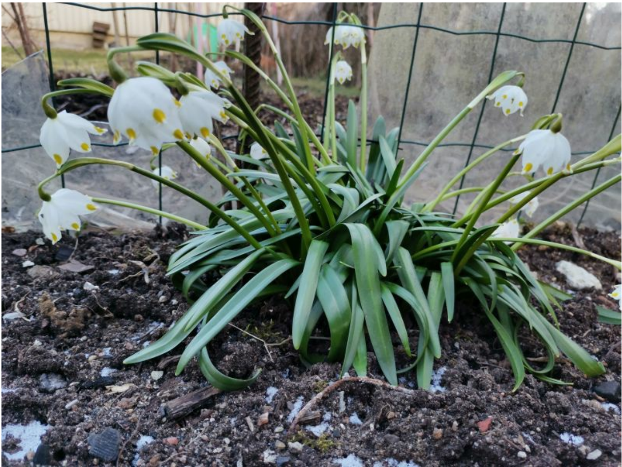
Klõpsa piltidel, avaneb originaal.