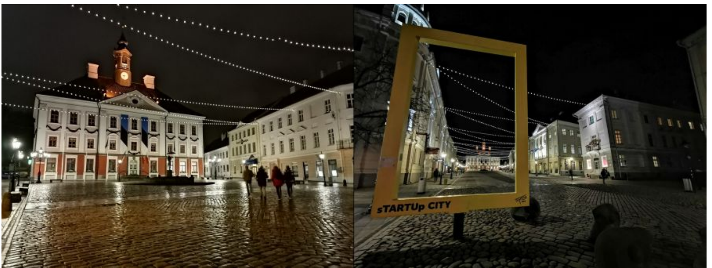
Vasakpoolne P Smart Pro pilt on seekord küll värviderohkem kui eelmine, aga sellist lainurka, nagu Mate 20 Pro'l, testitav telefon öövõttega ei paku.

Üldiselt saab P Smart Pro'ga samuti täiesti korralikke pilte teha, kuid kvaliteedi stabiilsus on kehvem kui tippkaamerateaga - automaatika teeb eksimusi värvide määramise ja teravustamisega rohkem, aga kui teed vanakooli moodi rohkem klõpse samast asjast, siis lõpuks mõne hea kaadri ikka leiab.