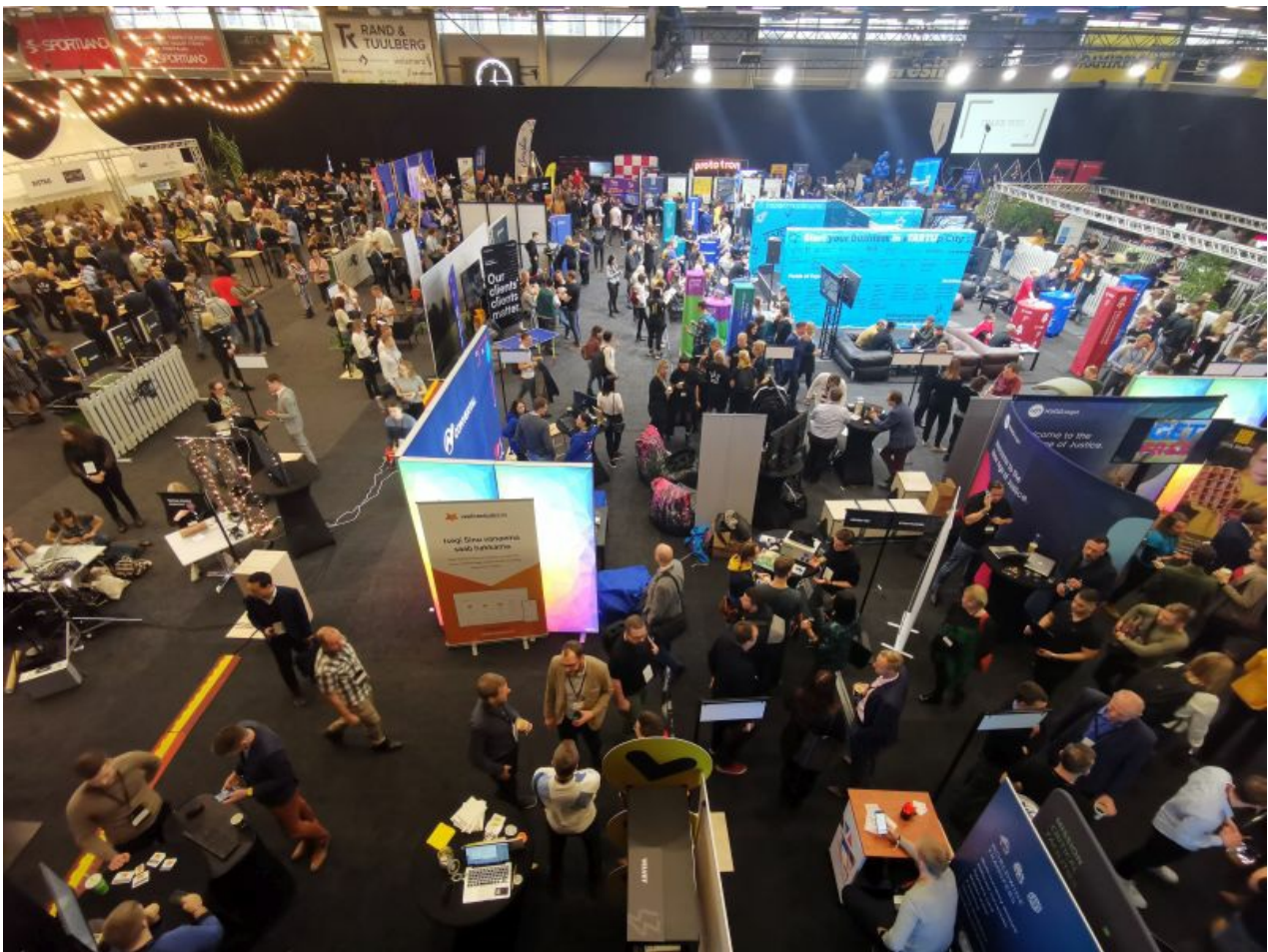
Üldplaanis: Startupid on investoreid otsimas ja loomulikult kliente ka. Tartu Ülikooli spordihoone tagumine saal.