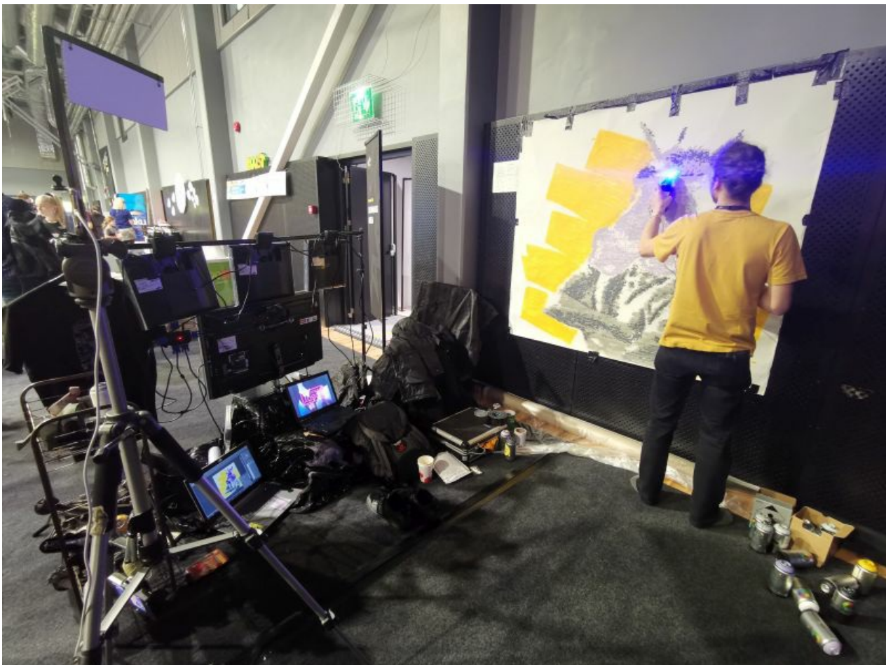
Sprayprinter. Soliidses eas idufirma juba, alustas 2015. aastal.