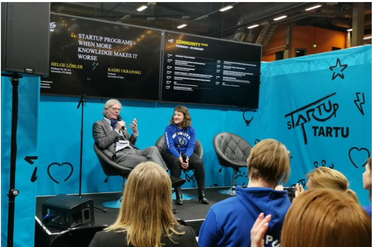
Hetk Community Stage'ilt.