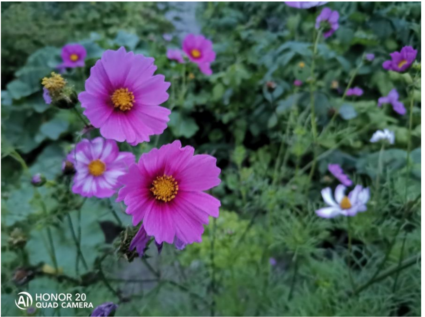
Vaata testpilti bokeh -efektiga: