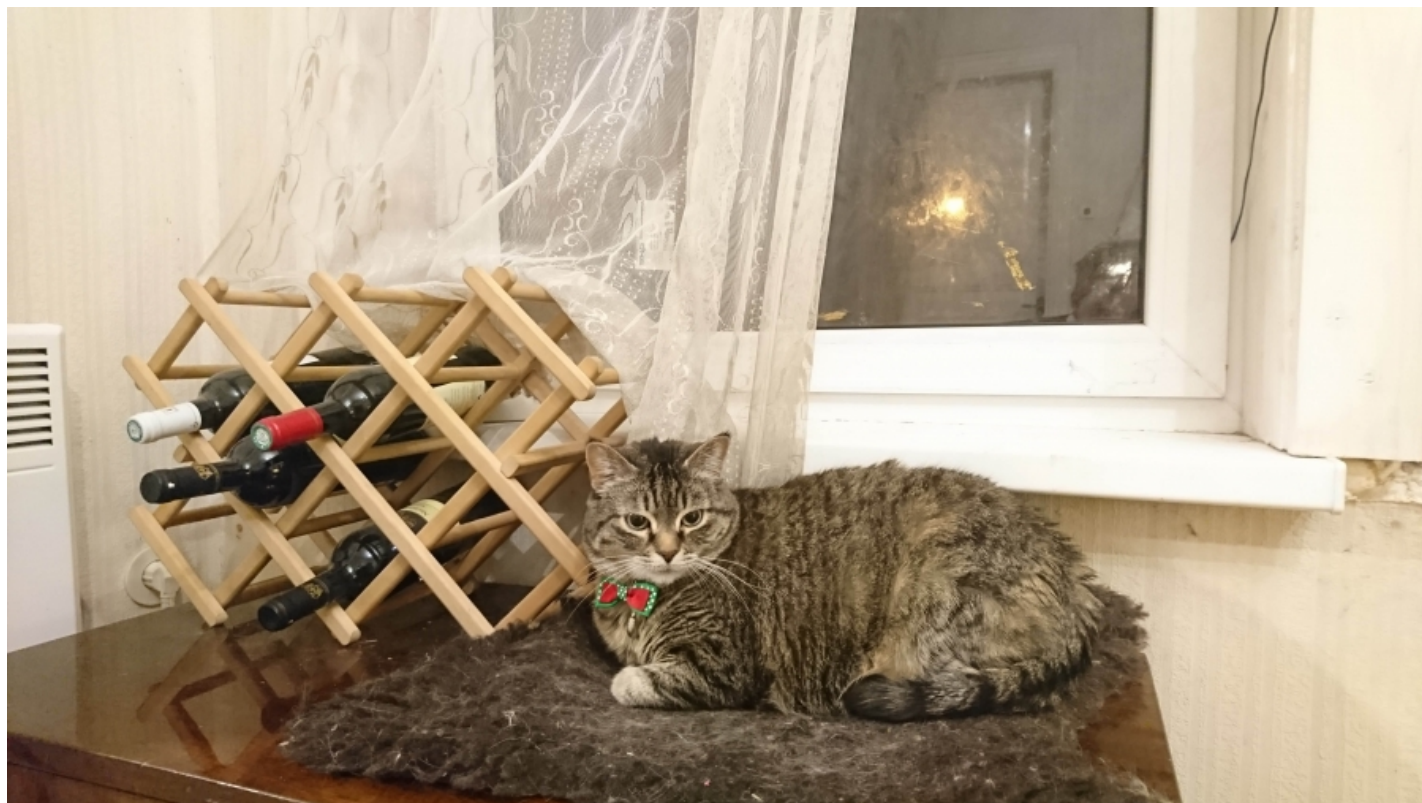
Sony Xperia XZ.

Automaatrežiim teeb valges päris häid pilte, ning ägeda nimega hübriidfookus kiirendab fokuseerimist ka liikuvate objektide puhul. Olgugi, et Sony toodab sensoreid väga palju ka teistele brändidele ja väga häid, pole pildid Sony enda seadmes mitte tippklassist, vaid pigem kõva keskmine. All on pildid Aasta Telefoni finalistide kaameratest. Klõpsa pildil, avaneb originaal.