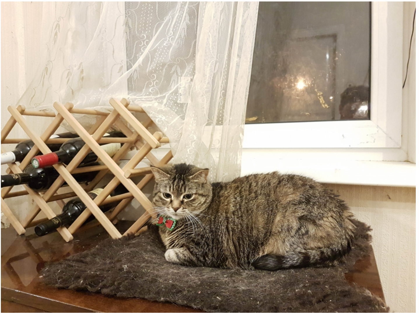
Samsung Galaxy S7.

Kaameral saab seadistada säriaega ja ISO. Kui muudad ISO ja peale seda hakkad muutma säriaega, muutub ISO automaatseks.