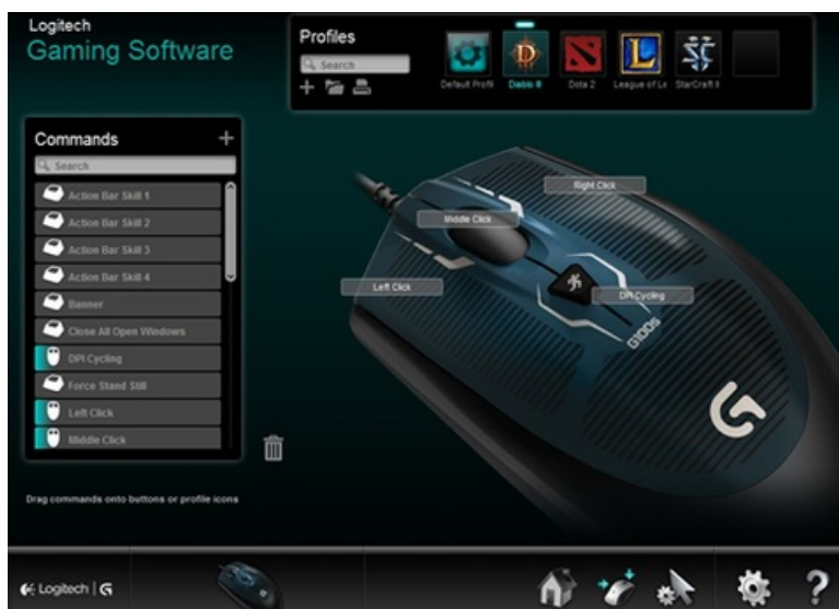
Pilt 2. Hiire nuppude sätted.

Esimese asjana programmi käivitades tuvastab see ära, mis mängud on installeeritud ja pakub vastavalt mängule hiir ära seadistada. (See on koht, kus ma tunnen, et hiirel võiks paar pöidlaalust lisanuppu olla).