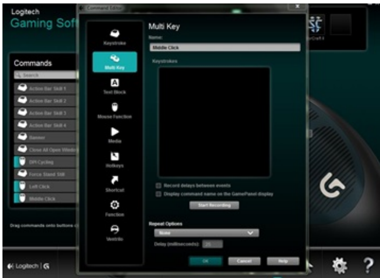
Pilt 3. Nuppude täppis-seaded.

Kokkuvõttes on Logitech välja tulnud odavapoolse mängurihrega (39 Ameerika dollarit kodulehe järgi), mis on mõeldud nii parema- kui ka vasakukäelistele. Kahekäelisuse tõttu jätab hiir natukene soovida ergonomika osas. Logitech on läinud turvalist teed ja teinud hea universaalse hiire, aga mitte hiire, millega oleks nauding mängida. Need kaks küljenuppu ei anna rahu, kasvõi netis sirvimiseks. Hiir võiks ju olla võimekas ka mujal kui mängimisel: kasvõi arvutitöödel, fototöötlustes!