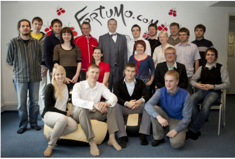
Fortumo tiim koos vabariigi presidendi Toomas Hendrik Ilvesega.